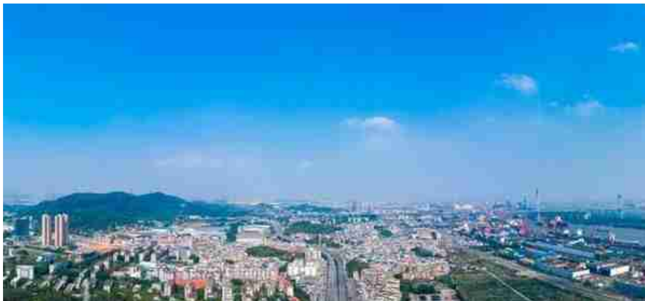
| 老黄埔双沙

实际上，自2020年来，合景就多次进行了旧改项目的股权质押，虽是常见的融资手段，但也难掩自身资金压力。