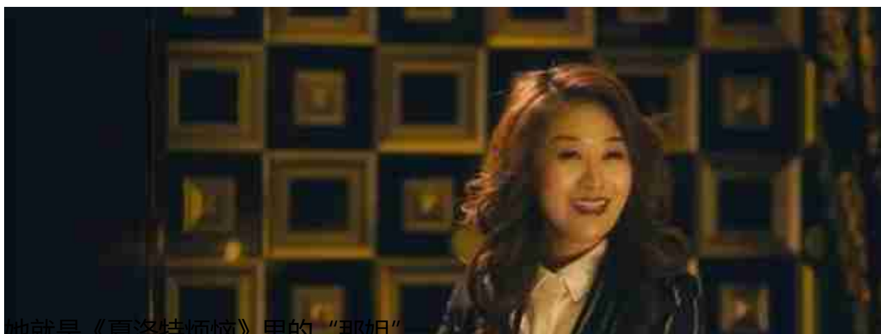
她就是《夏洛特煩惱》里的“那姐”。