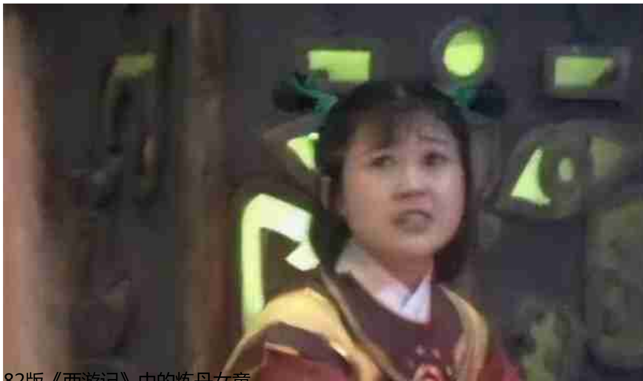
82版《西游记》中的炼丹女童