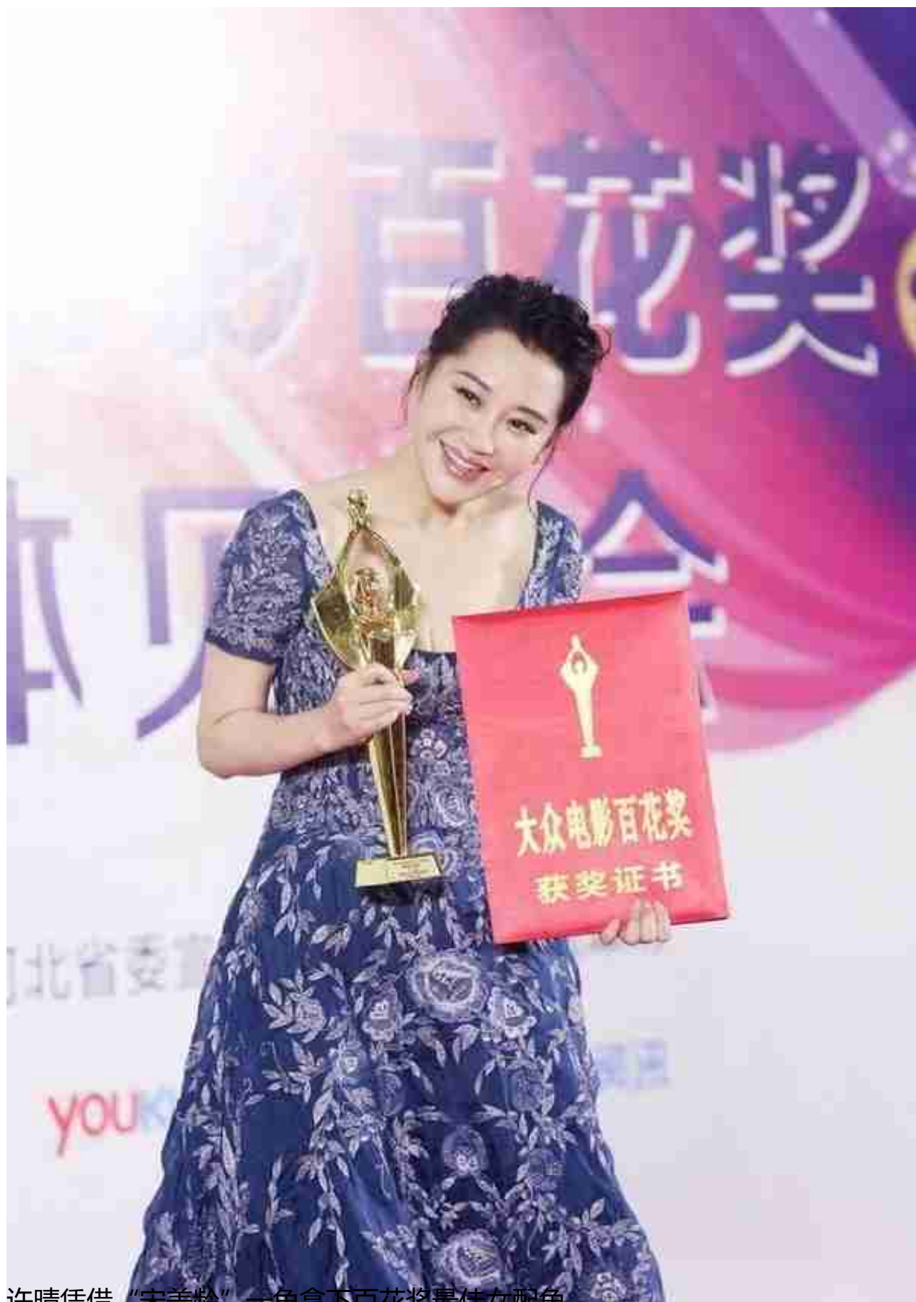
许晴凭借“宋美龄”一角拿下百花奖最佳女配角