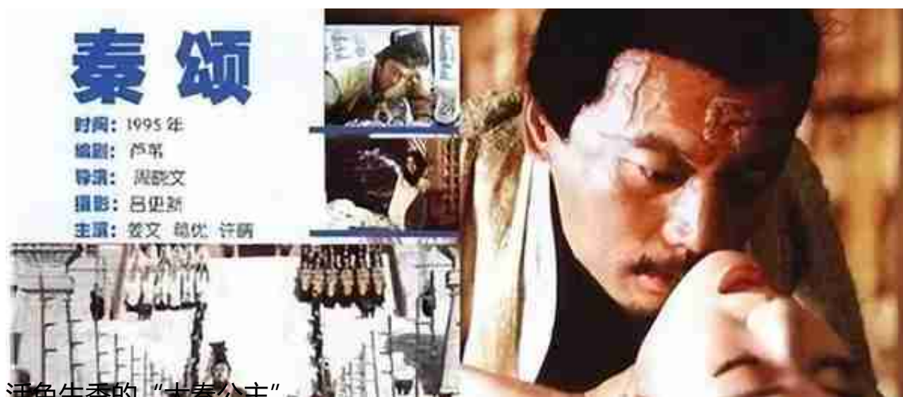
活色生香的“大秦公主”