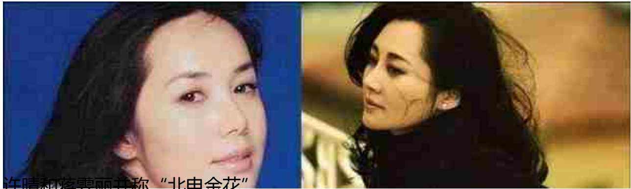
许晴和蒋雯丽并称“北电金花”