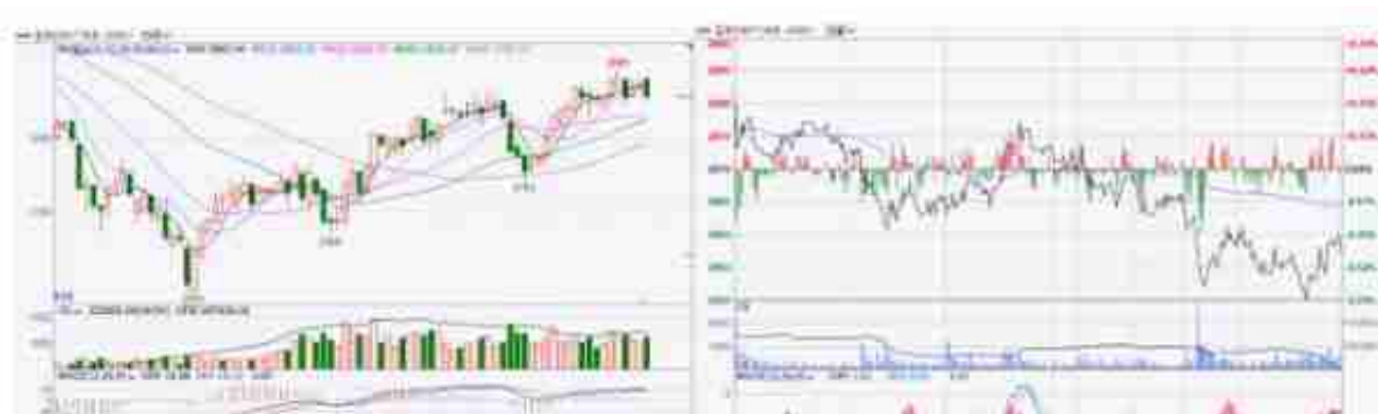
【CS2301 K线图】 【CS2301 分时图】