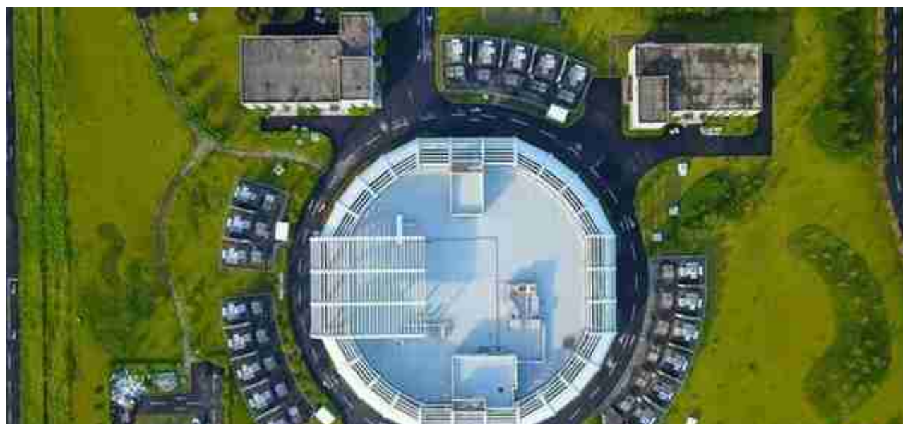
这是在广东省东莞市大朗镇拍摄的中国散裂中子源（2019年7月24日摄，无人机照片）。

制造业数字化离不开基础研究支撑。鹏城实验室，中国散裂中子源，深圳大亚湾中微子实验站，国家超级计算广州中心……广东日渐密集的大科学装置，为基础研究积蓄能量。