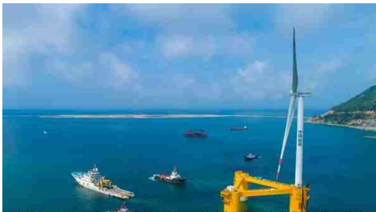
国内首台深远海浮式风电装备“扶摇号”从广东省茂名市广港码头拖航前往罗斗沙

获批建设大湾区国家技术创新中心、国家新型显示技术创新中心、国家5G中高频器件创新中心，聚力推进高水平科技自立自强，打造具有全球影响力的科技和产业创新高地，广东经济竞争力、持续力显著增强。