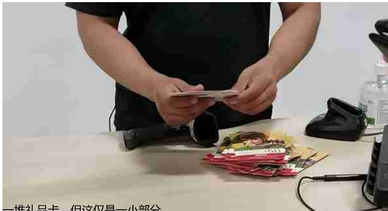
一堆礼品卡，但这仅是一小部分