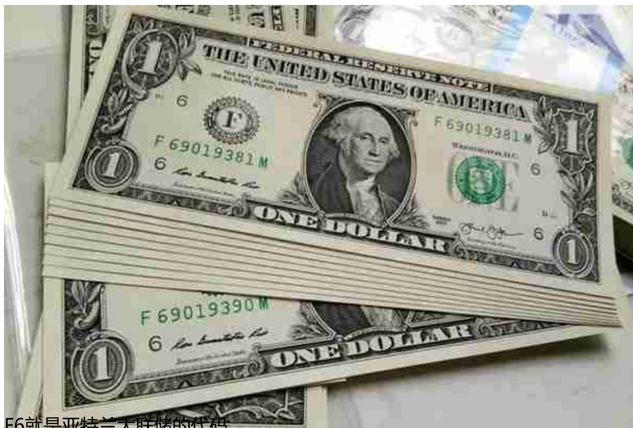
F6就是亚特兰大联储的代码

美联储最重要的部门是联邦公开市场委员会 ( FOMC )。他们每年开会八次，每六周一次，以决定美元的基准利率。美元基准利率不同于国人普遍理解的中国央行存贷款利率。所以不要以为美联储的利率是0.25%，美国人只有存钱才能得到这个利息。