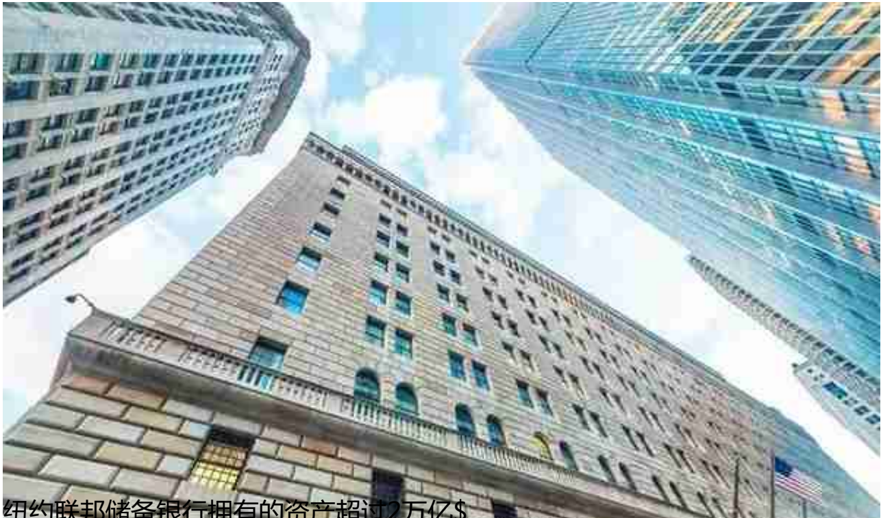
纽约联邦储备银行拥有的资产超过2万亿$