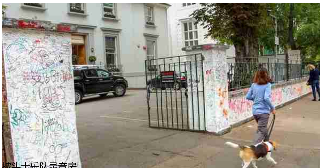
披头士乐队录音房

据说博物馆的结构与小说中完全相同，加上精心的布置，使来此参观的人如同置身于小说的场景之中。本想进去参观，外面排了近20人，只好打卡了事。