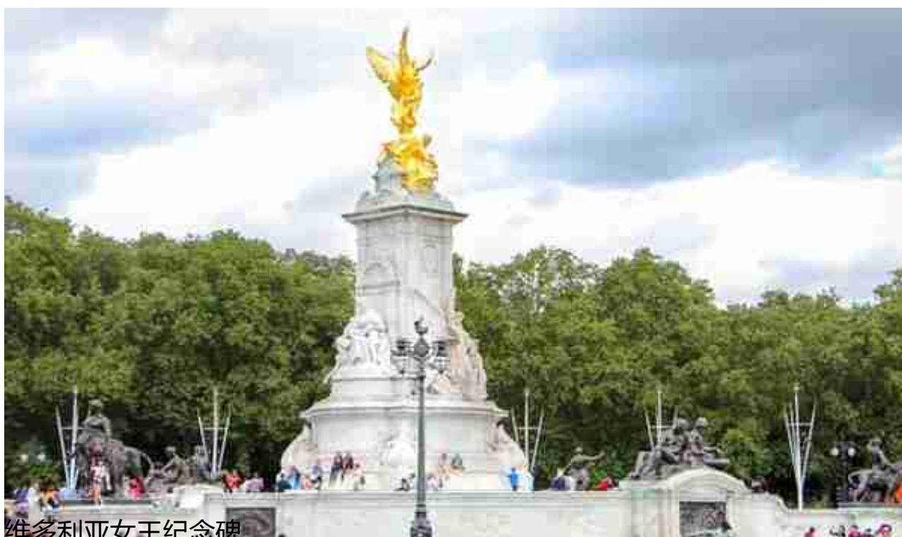
维多利亚女王纪念碑

距皇家马厩100米就是女王画廊The Queen Gallery，没时间进去看了。画廊门口躺了一位男子在晒太阳，不知是不是乞丐。