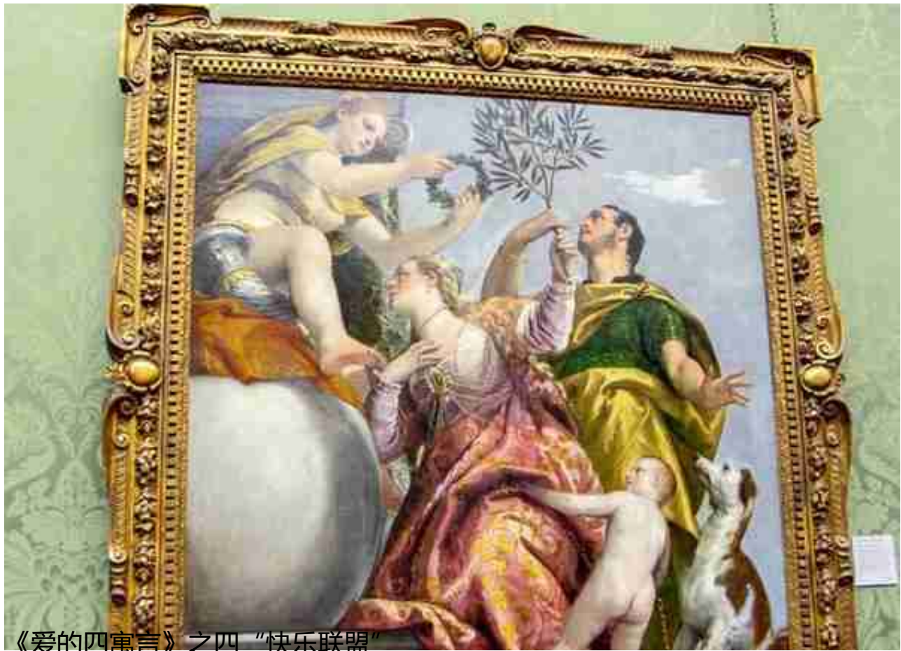
《爱的四寓言》之四“快乐联盟”

来 国家美术馆的游客比刚才的国家肖像馆的要多得多，在一些热门展厅的休息凳上都坐满了。