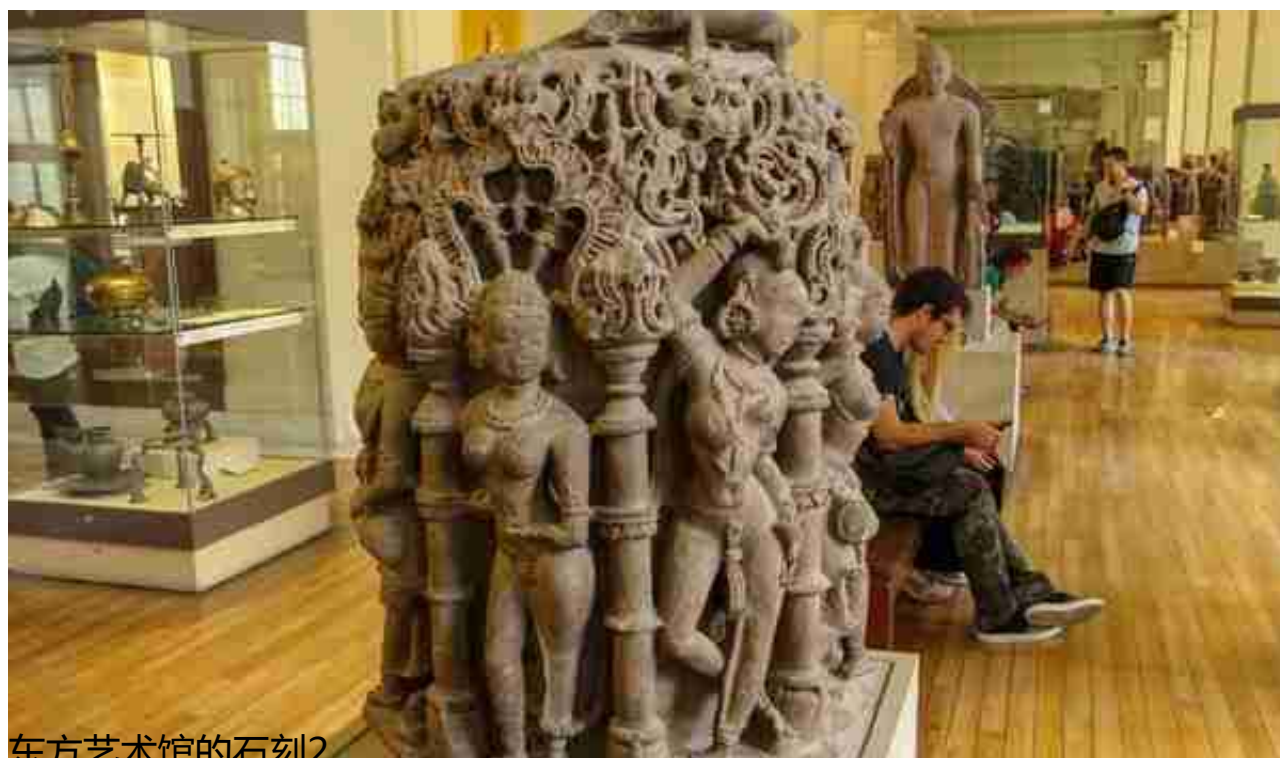
东方艺术馆的石刻2

说实话，来 大英博物馆前，做的功课不充分，没什么目标，走哪儿看哪儿，有顺眼的就拍下来 。