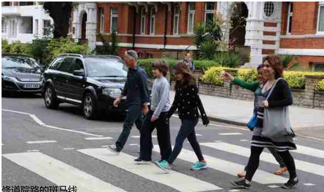
修道院路的斑马线

正因为如此，在修道院路Abbey Road的这条斑马线两边才没有设置红绿灯，过往车的司机也一般都会停下来，让粉丝们在斑马线上向偶像致敬。