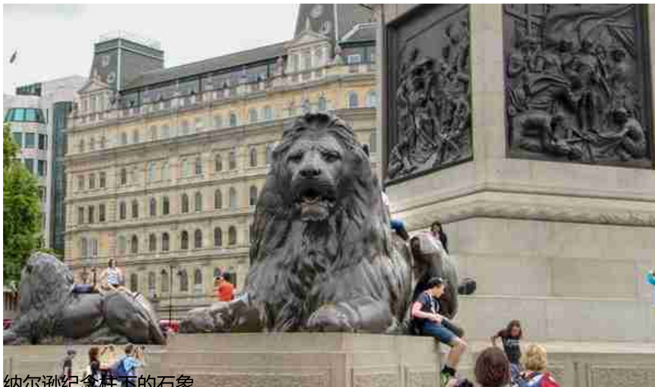
纳尔逊纪念柱下的石象