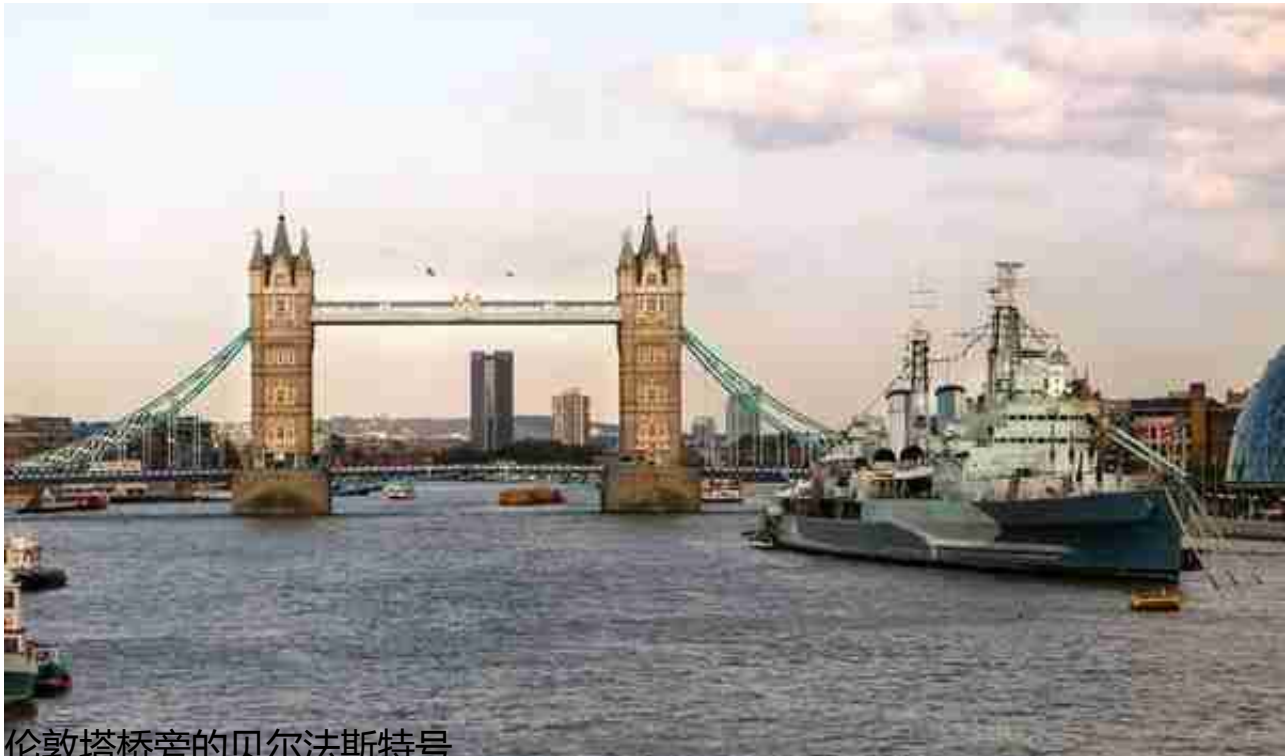
伦敦塔桥旁的贝尔法斯特号

沿河北岸行走，对面的碎片大厦是伦敦最高的建筑，高309.6米，于2012年建成，是伦敦的地标建筑，可以俯瞰整个伦敦。