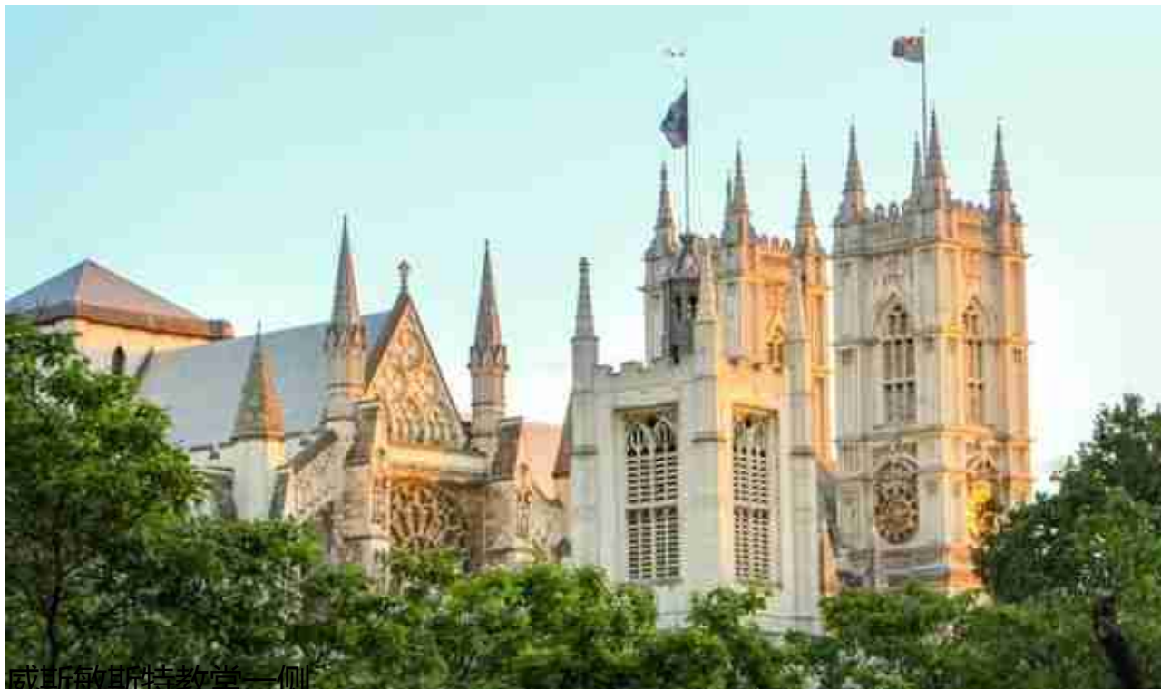
威斯敏斯特教堂一侧

特宫的后面是威斯敏斯特教堂， 是世界上最大的哥特式建筑。教堂上那众多的塔尖，可以和4年后（2019）在意大利米兰见到的有一百多个塔尖的米兰大教堂媲美。