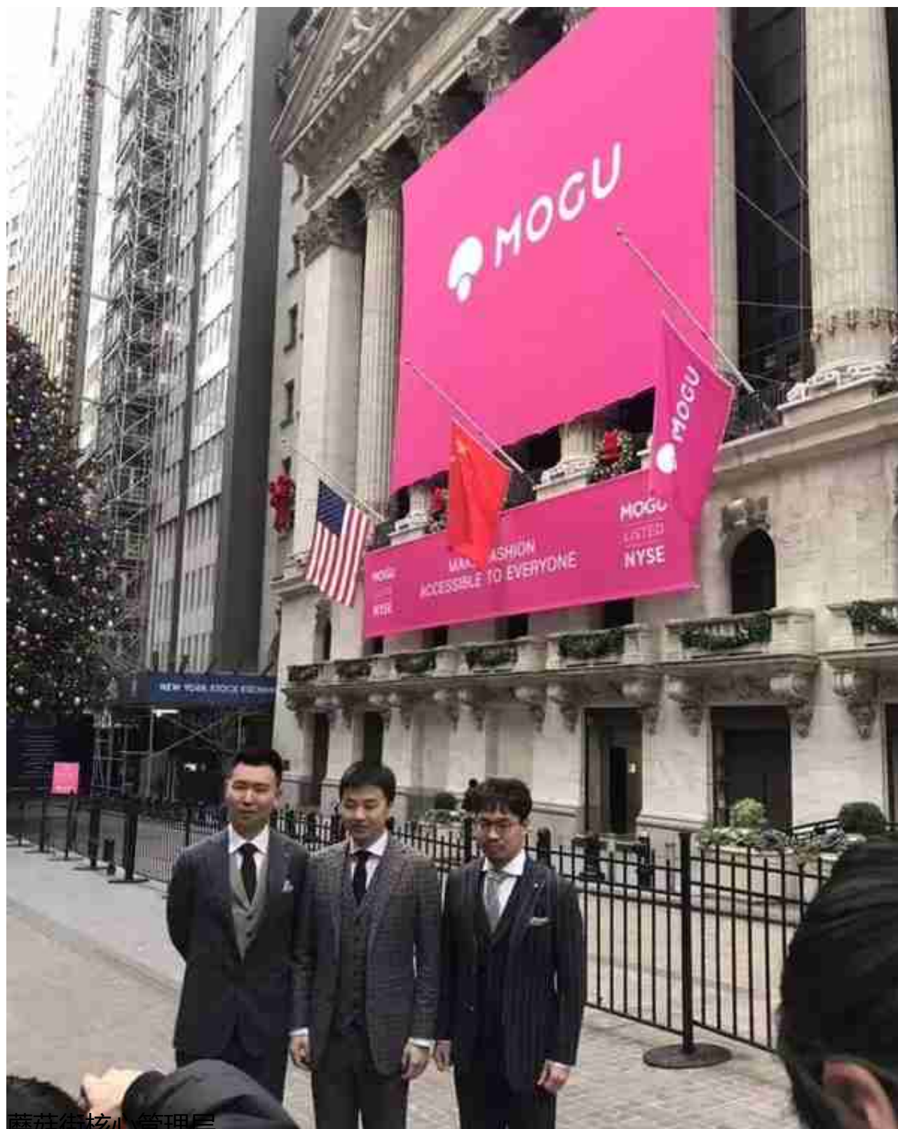
蘑菇街核心管理层

启明创投合伙人甘剑平、BAI (贝塔斯曼亚洲投资基金) 创始及管理合伙人龙宇、腾讯投资管理合伙人李朝晖为董事。