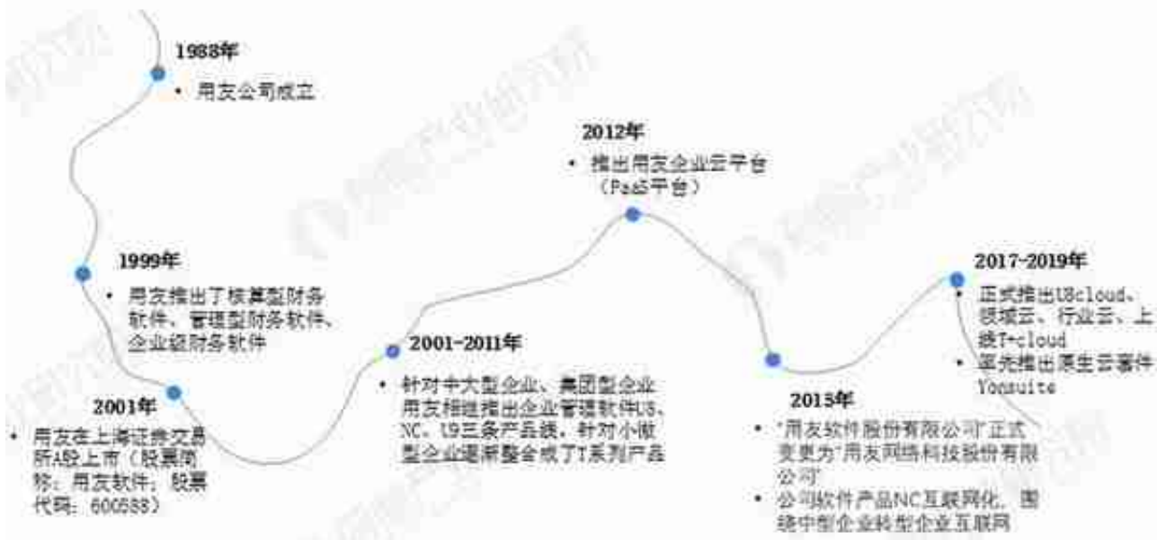
图表2：用友网络成长历程

目前国内工业互联网领先企业有用友网络、东方国信、启明星辰、浪潮信息等。其中用友网络与浪潮信息处于领先地位。从研发能力来看，用友网络从研发人员数量上具有优势，而研发投入金额上浪潮信息略胜一筹。从经营能力上看，浪潮信息营业收入大幅超过用友网络，而用友网络毛利率显著高于浪潮信息。