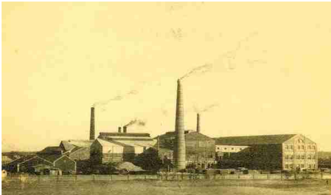
( 1933年耀华全景 )

回望耀华的发展历程不难发现，耀华恰恰与中国近代民族工业从无到有、从小到大、从弱到强的发展轨迹高度契合。可以说，耀华就是一本活的民族工业“历史书”。