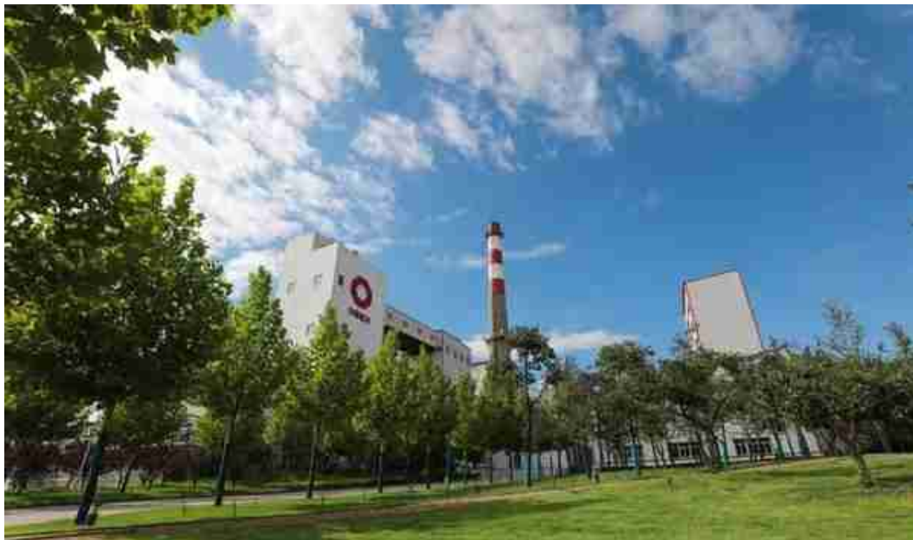
耀华集团被评为河北省绿色工厂

2021年，耀华经营性利润大幅增长，创近年来最好成绩，时隔33年再次荣获全国五一劳动奖状殊荣。