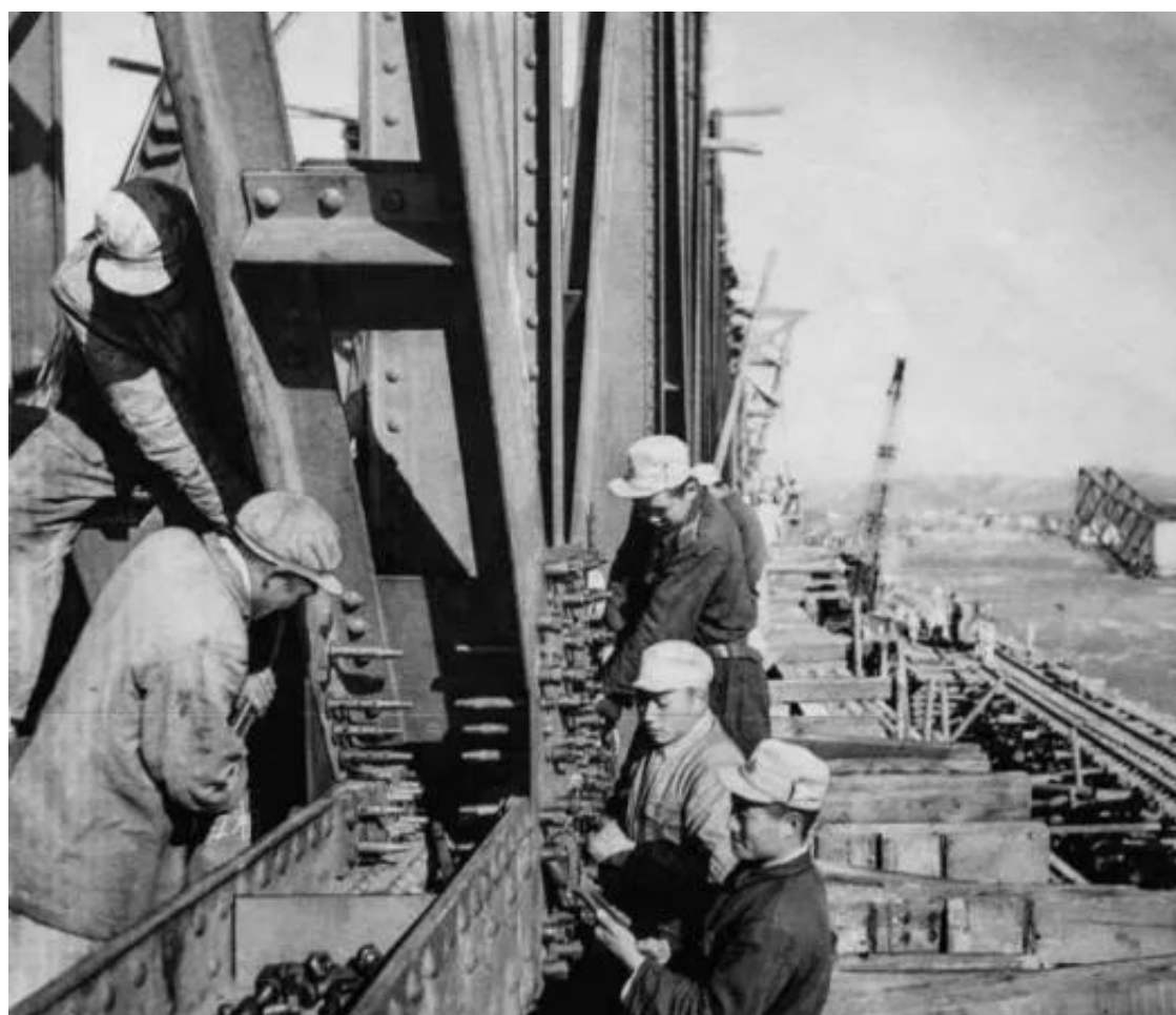
中朝军民一起修复大同江桥

大同江是朝鲜地理标志之一，位于朝鲜半岛西北部。平元线大同江桥，扼东去运输咽喉，是敌封锁重点，也是我铁道兵部队保卫的重点，双方的斗争异常激烈。1951年8月，大同江正桥遭毁灭性轰炸。铁道兵团限期9天抢通。铁道兵第四师于9月1日19时开始抢修，起用落水钢梁，移正位移钢梁，采用架设5片26米跨度的单层军用梁，以顶牛通车的办法争取时间。经过9天9夜奋战，战胜了洪水，战胜了敌人，终于在10日抢通了大同江铁路正桥。