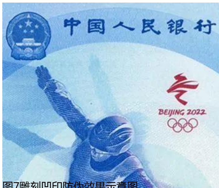
图7雕刻凹印防伪效果示意图