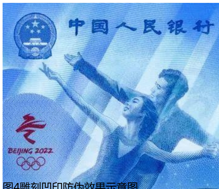
图4雕刻凹印防伪效果示意图