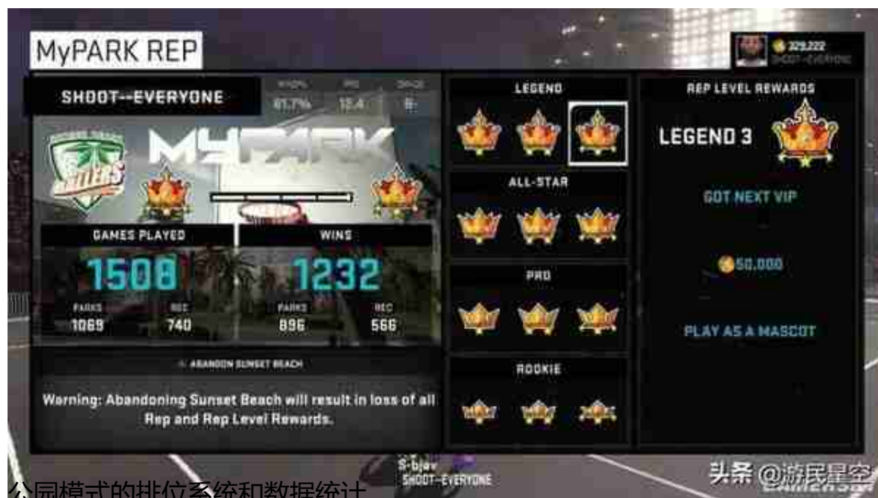
公园模式的排位系统和数据统计