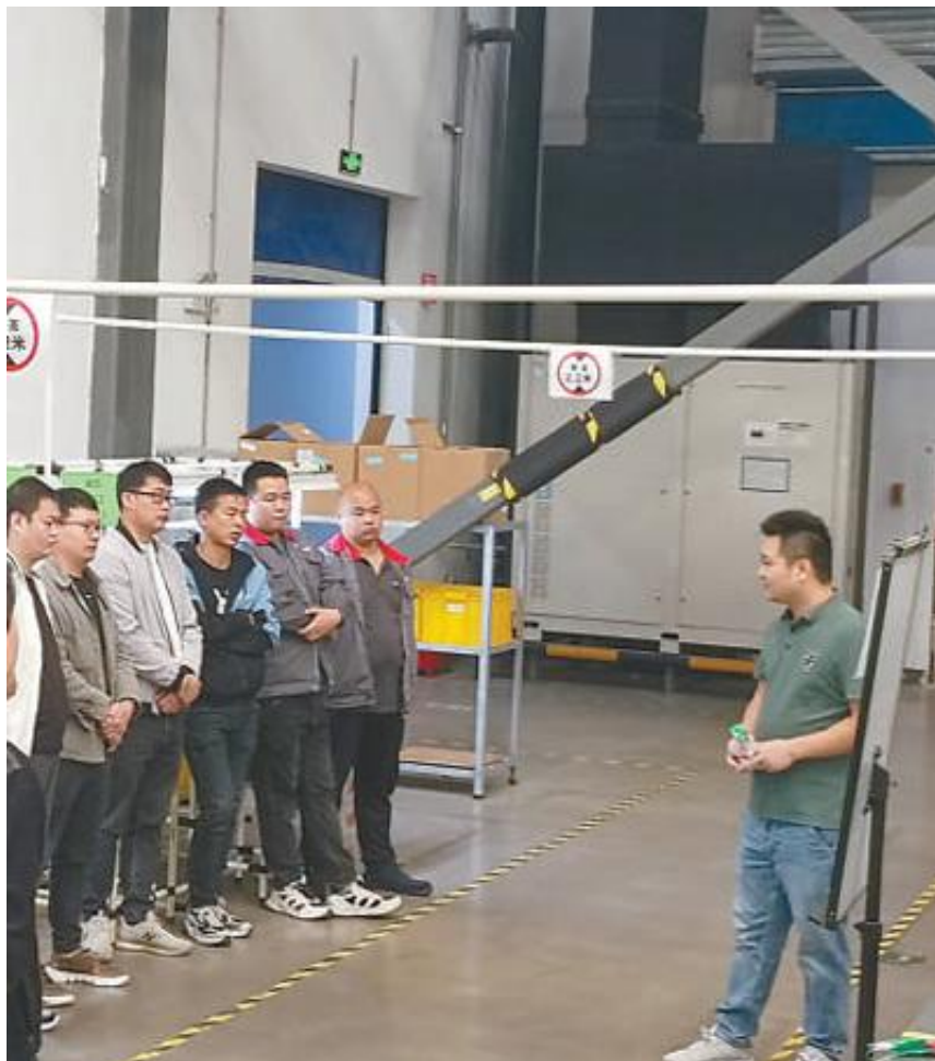
江苏骏伟精密部件科技股份有限公司员工在车间上理论课。 资料图片