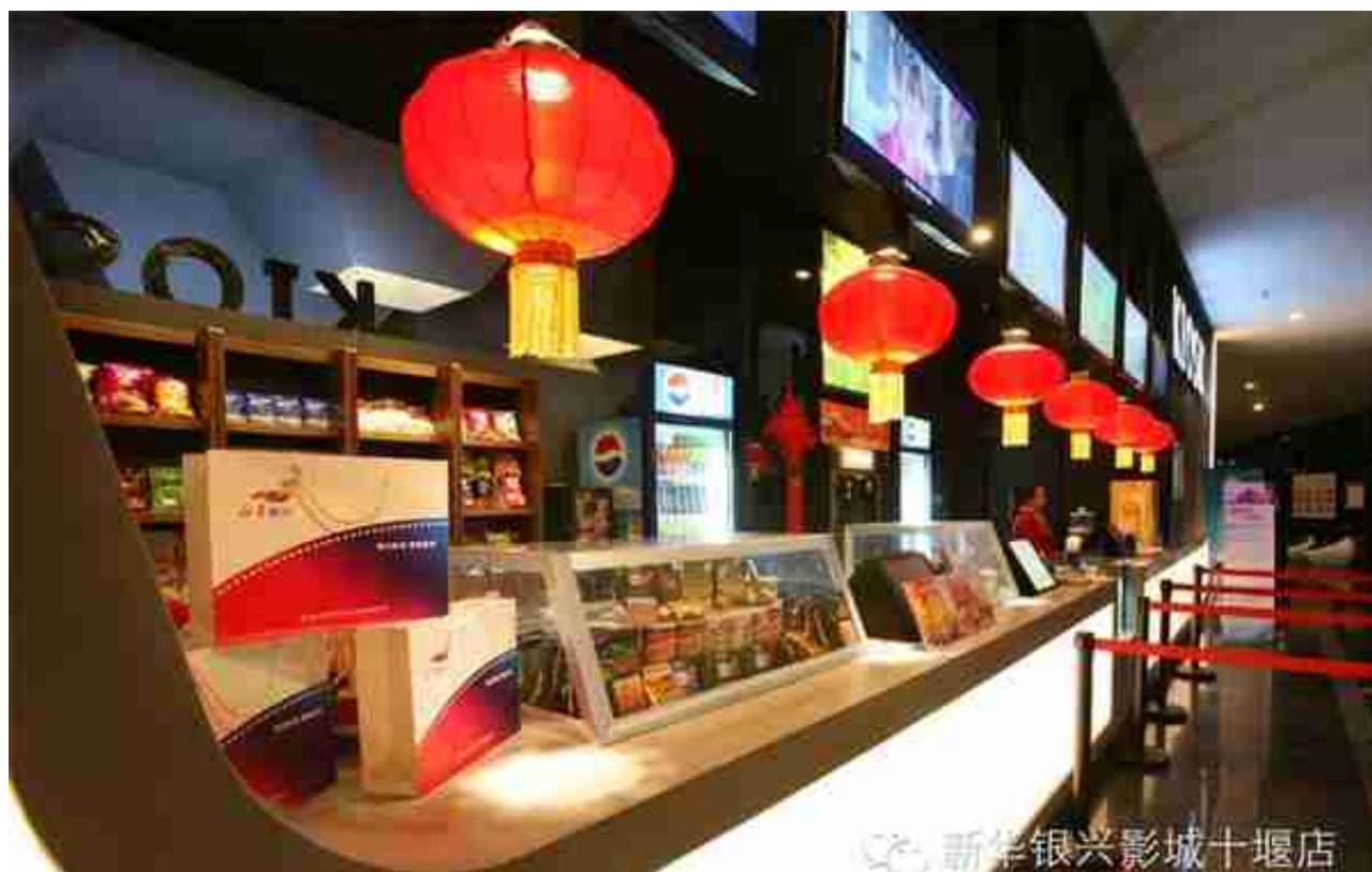
新华银兴影城十堰店

影院简介：新华银兴国际影城位于邮电街和信销品茂六楼，建筑面积约为4500㎡，共设8个影厅，1个“巨幕影厅”、1个豪华VIP厅、2个激光厅及4个高清数字厅，总座位数为1279座，秉持“魅力影海、博学致远”的理念，丰富观众的精神文化生活。