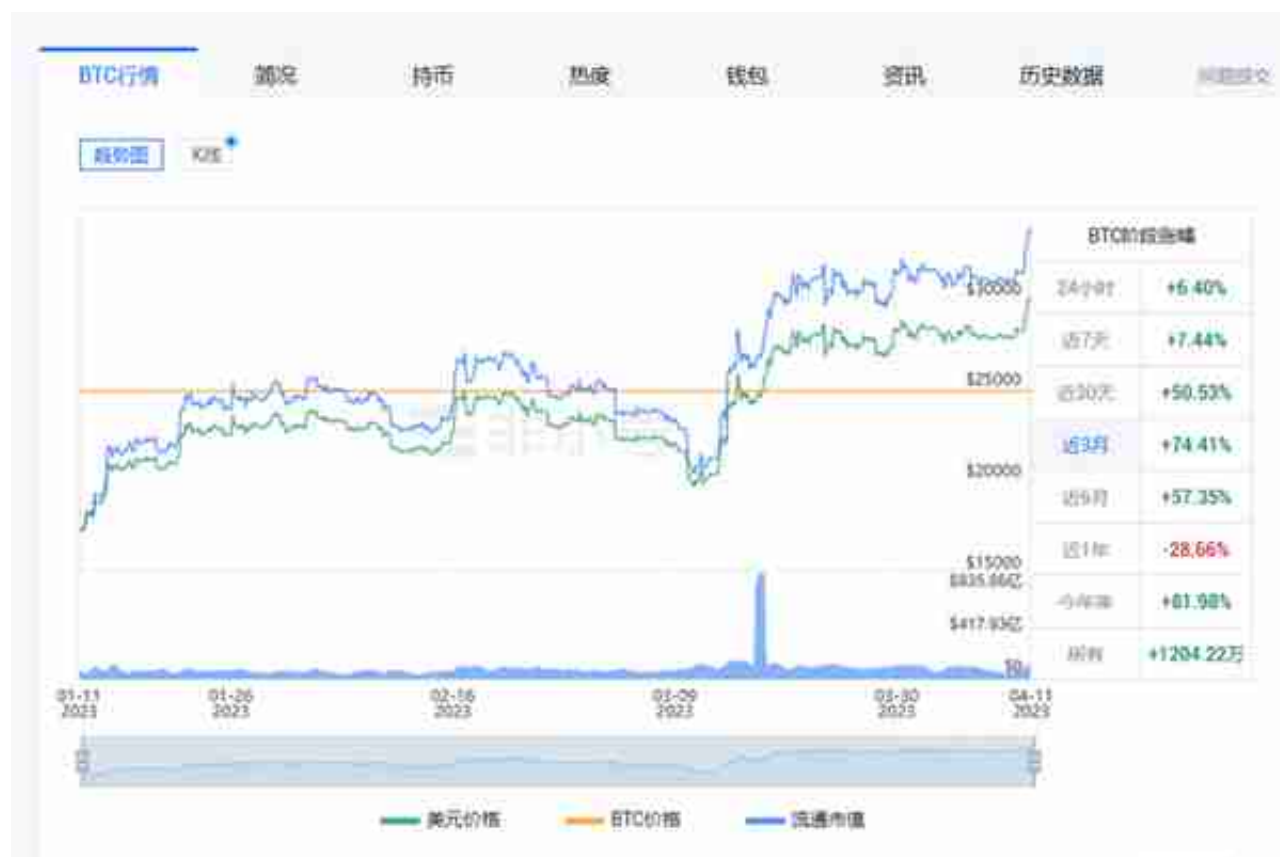
图片近3月比特币价格走势

自今年初以来，不断有投资基金等因虚拟货币价格较为低廉，而重新开始买入，虚拟货币价格多次出现反弹。例如近两日，就有外媒披露避险资金流入推动比特币暴涨，不过随着投机资金的回归，比特币价格大幅波动的风险也在上升。据《日本经济新闻》报道，比特币之所以能吸引大量资金，是因为它具有无需保值资产支持的特点，因而再次受到投资者追捧。