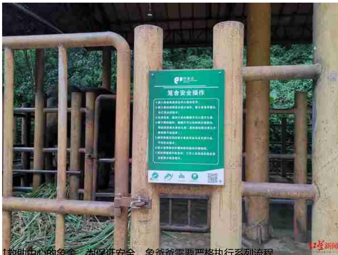
↑救助中心的象舍，为保证安全，象爸爸需要严格执行系列流程

2015年8月，一头亚洲象闯进普洱市思茅区思茅港镇橄榄坝村坝卡小组一户村民家的柴房里，它就是后来的羊妞。