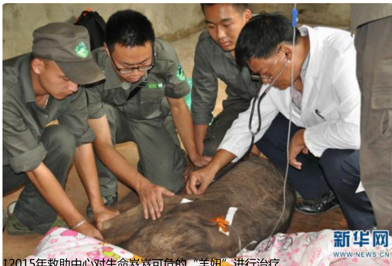
↑2015年救助中心对生命岌岌可危的“羊妞”进行治疗。

救助羊妞的第一步是清创、消炎、喂葡萄糖。因现场医疗条件有限，救助人员把它抱到一辆小型卡车上往救助中心赶。因担心羊妞二次受伤，救助人员在镇上买了一些棉被将它包裹住。