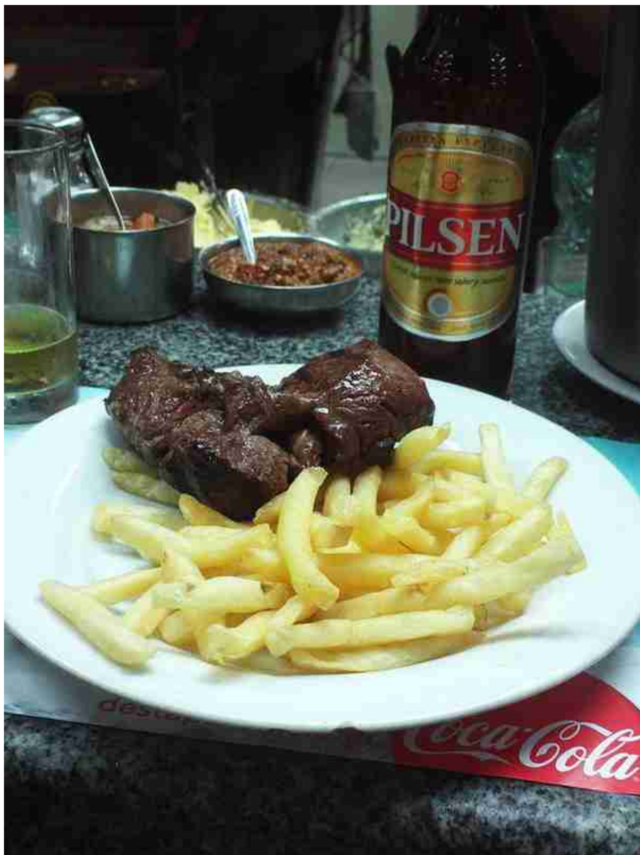
Asado - 南美风情烧烤