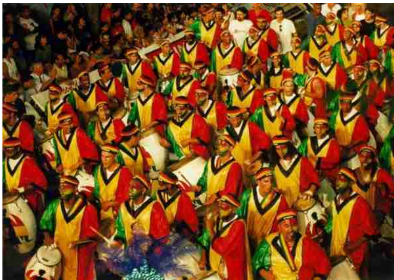
Desfile de Llamadas, Montevideo carnival