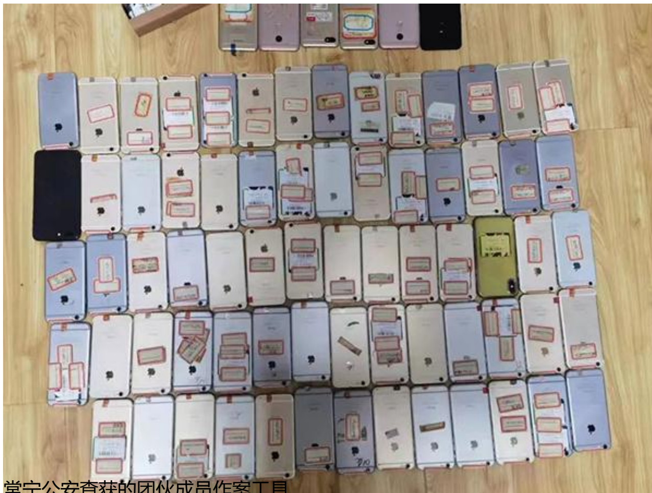
常宁公安查获的团伙成员作案工具

“初步调查发现，该团伙以前曾与缅北、老挝等地电信诈骗窝点有接触或关联。”常宁市公安局相关工作人员介绍，“他们都是本地乡镇的，文化水平不高。”