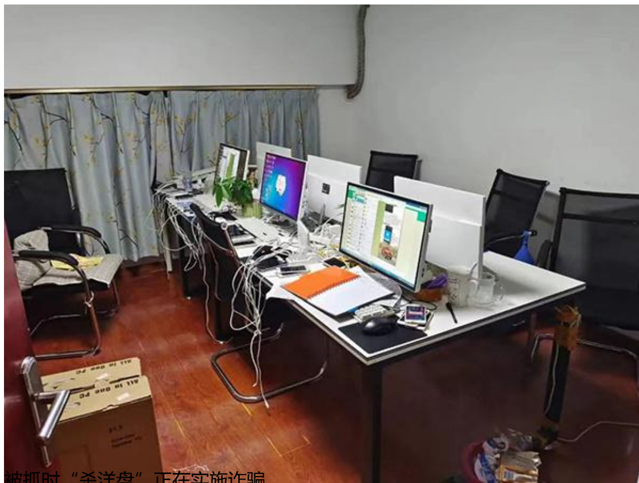
被抓时“杀洋盘”正在实施诈骗。

假扮白富美、高富帅网络“交友”，欺骗受害人感情，诱导受害人投资、博彩或者直接向受害者索取钱财，这种诈骗方式被称为“杀猪盘”。近期，这一电信网络诈骗方式又出现了新变种：诈骗分子开始瞄准外国人，利用翻译软件和外国网友聊天“交友”，以相同手段获取被害人信任后骗取钱财，这种诈骗被称为“杀洋盘”。