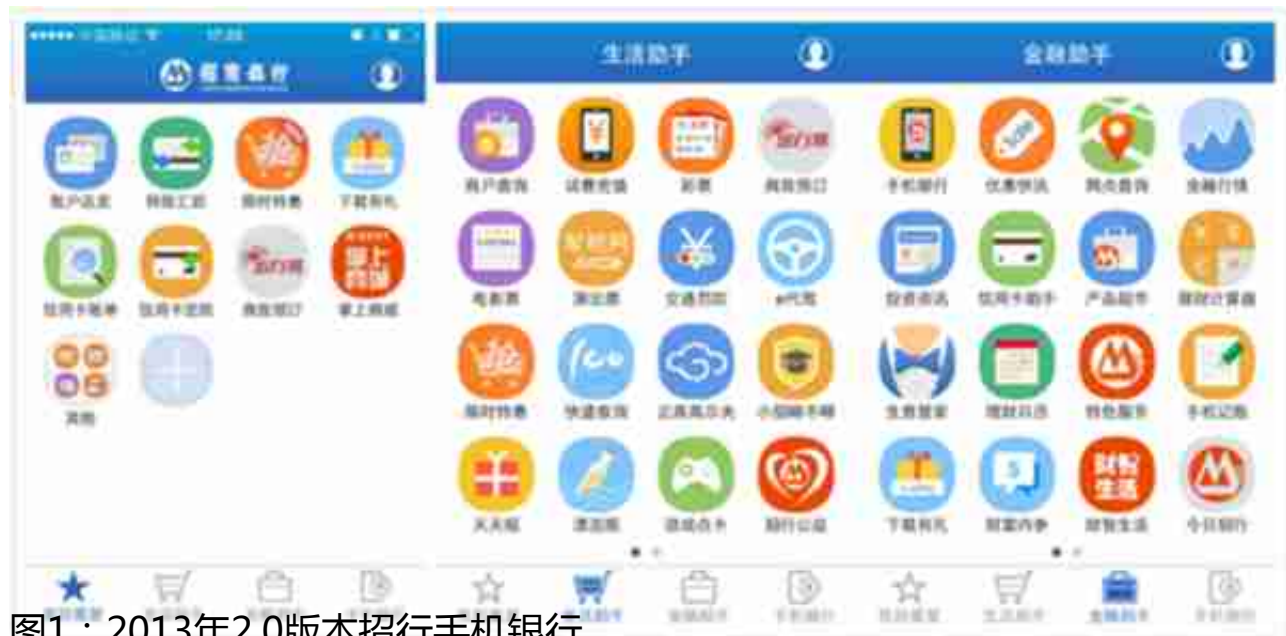
图1：2013年2.0版本招行手机银行

招商银行与掌上生活App遵守招行的共同发展战略，分别侧重金融与生活场景，其协同发展模式可以总结为：外接流量、建设场景、反哺金融。