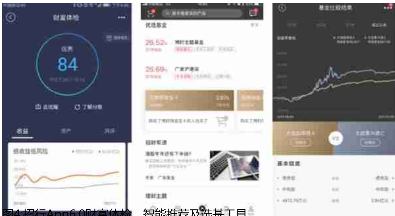
图4.招行App6.0财富体检、智能推荐及选基工具

从数据角度分析可以看出，摩羯智投构建的投资策略是线性组合的，是以风险收益为基础的资本资产定价模型，其对普通用户而言是简单、快速的投资方式，但相对于专业的基金经理而言仍然相差甚远（引用自《数据解读摩羯智投》 https://zhuanlan.zhihu.com/p/26398462 ）。从推出一段时间后的用户评价而言，实际收益率低是最核心问题，不免让人质疑其“智能”程度。