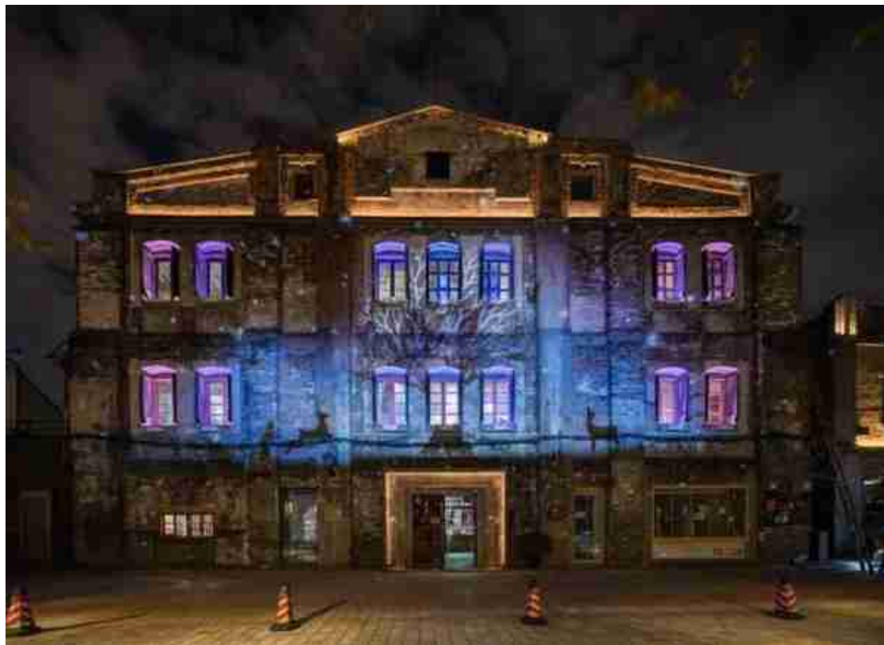
有为工社夜间灯光

苏州河黄浦区段景观照明有些是常态化开启的夜景点位，部分动态创意灯光将只有在重大节庆、重大活动时不定期开放。