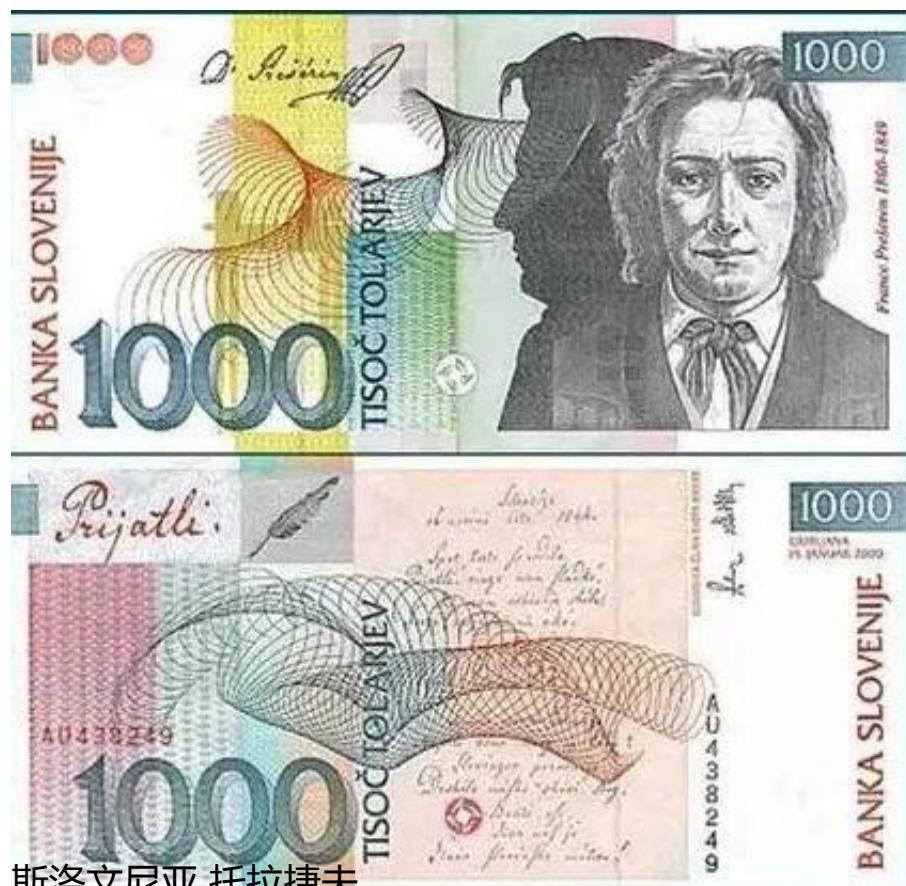
斯洛文尼亚 托拉捷夫