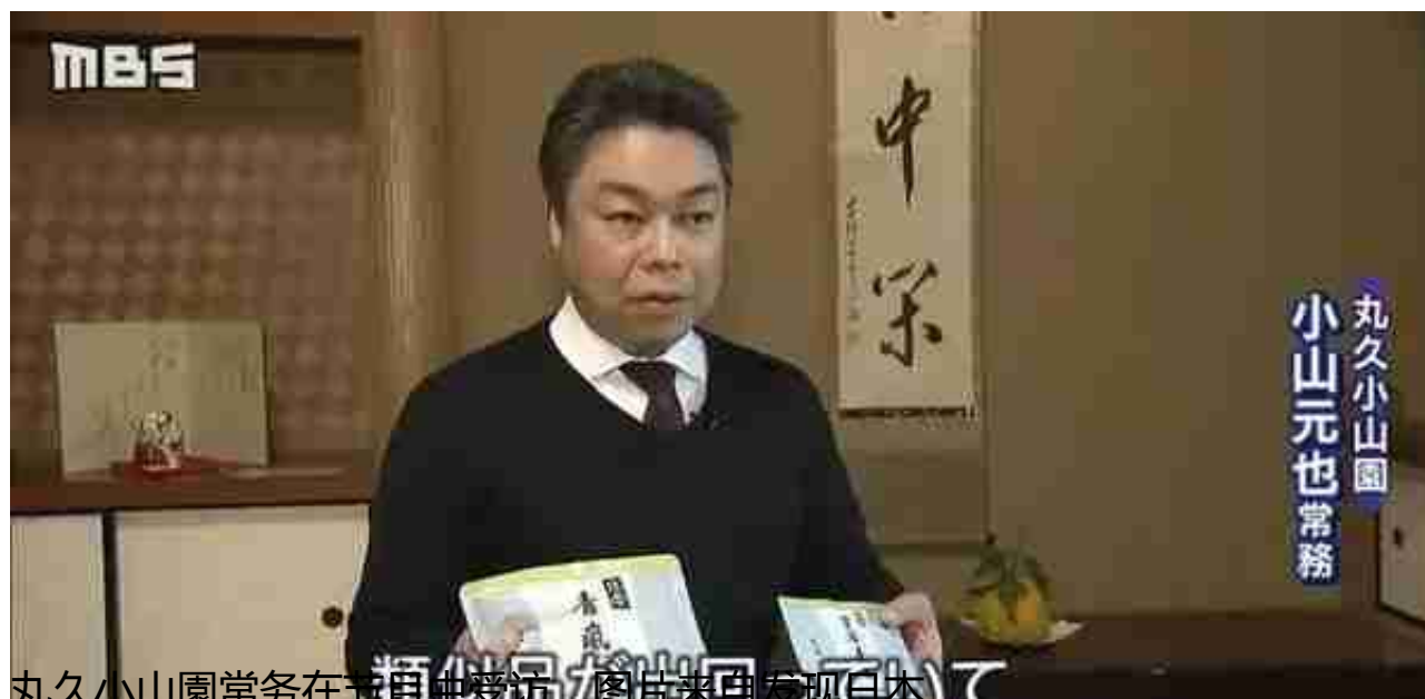
丸久小山園常务在节目中受访，图片来源发现日本

在某宝搜索宇治、抹茶粉等关键词，确实出现多种类似包装的产品。除此之外，还有若竹、五十铃等多款商品被山寨。