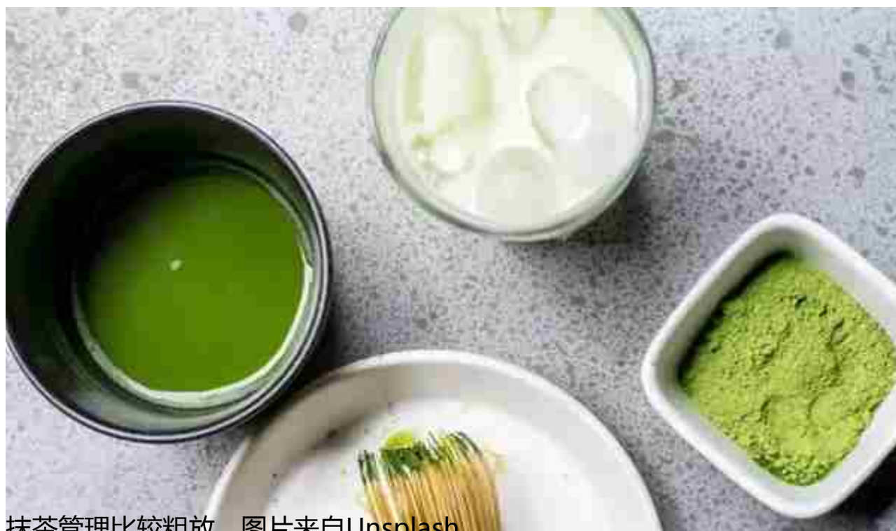
抹茶管理比较粗放

国内具备实力的抹茶原料制造厂商，比如贵茶集团，都在制定内部质量标准，以符合供应需求。