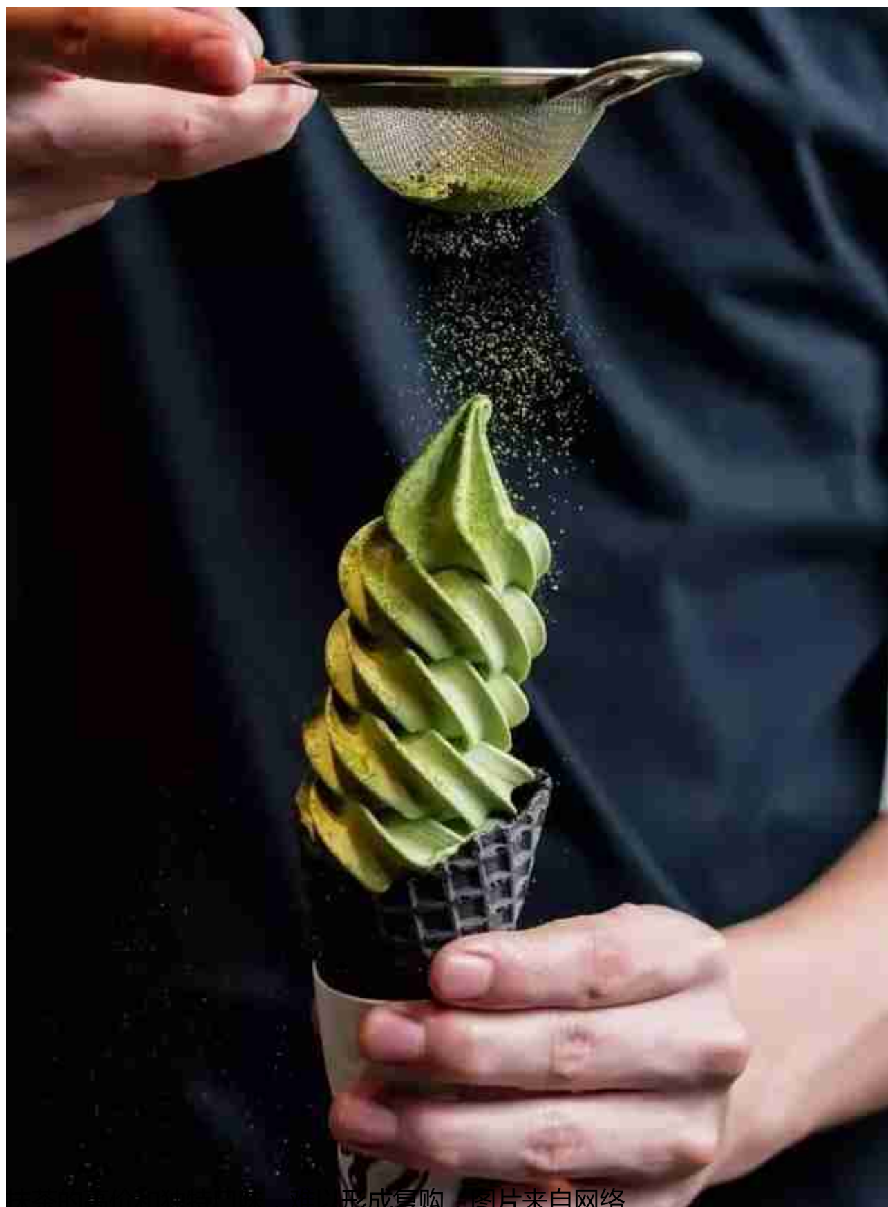
抹茶的高价和独特的口味，难以形成复购，图片来自网络