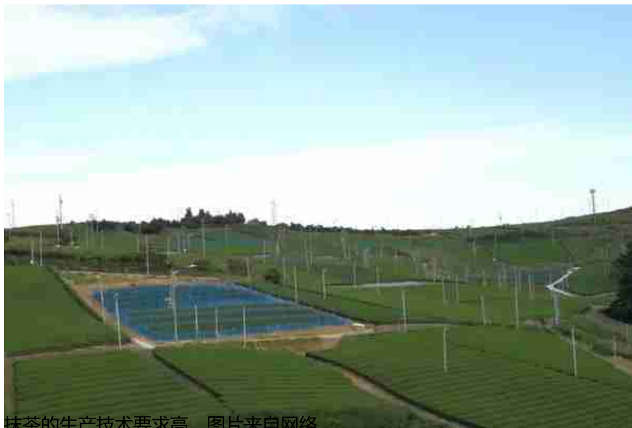
抹茶的生产技术要求高，图片来自网络

一个简单的例子，配合种植环节的需求，遮荫网需要提供准确的遮荫数据，才能保持对抹茶生长条件的监控。而目前国内生产的遮荫网大部分都难以实现，更不要说精细化的管理方法和技术——整个抹茶发展的产业链都处于不够完善的阶段。