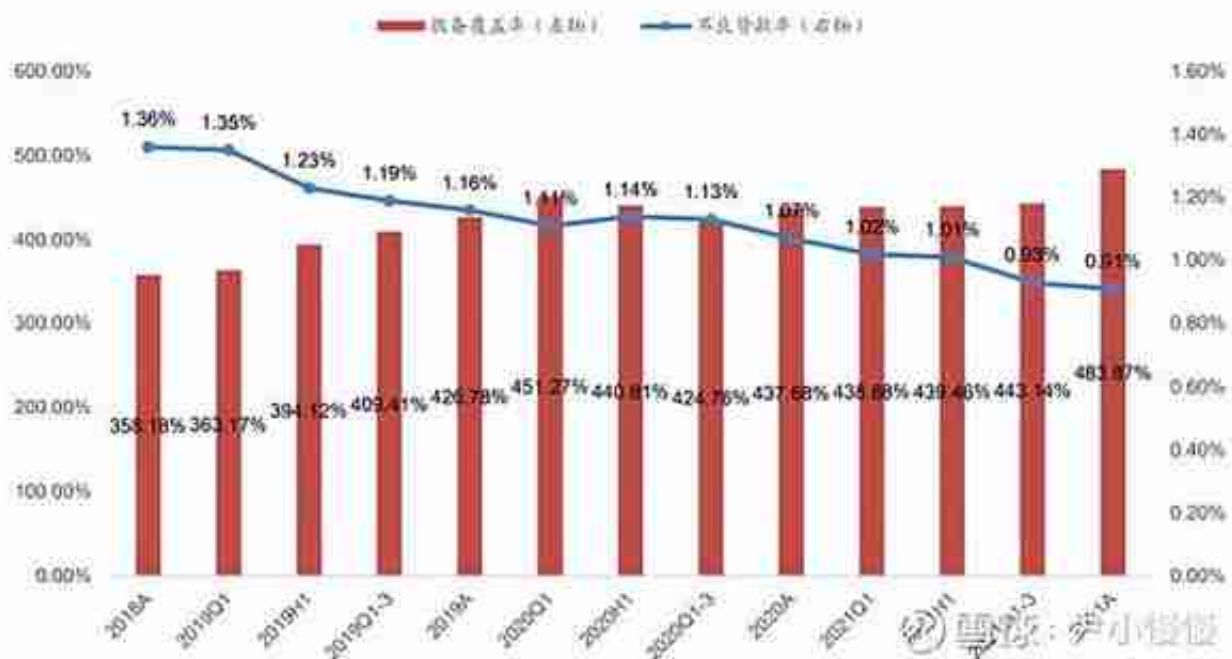
图16: 不良率和拨备覆盖率