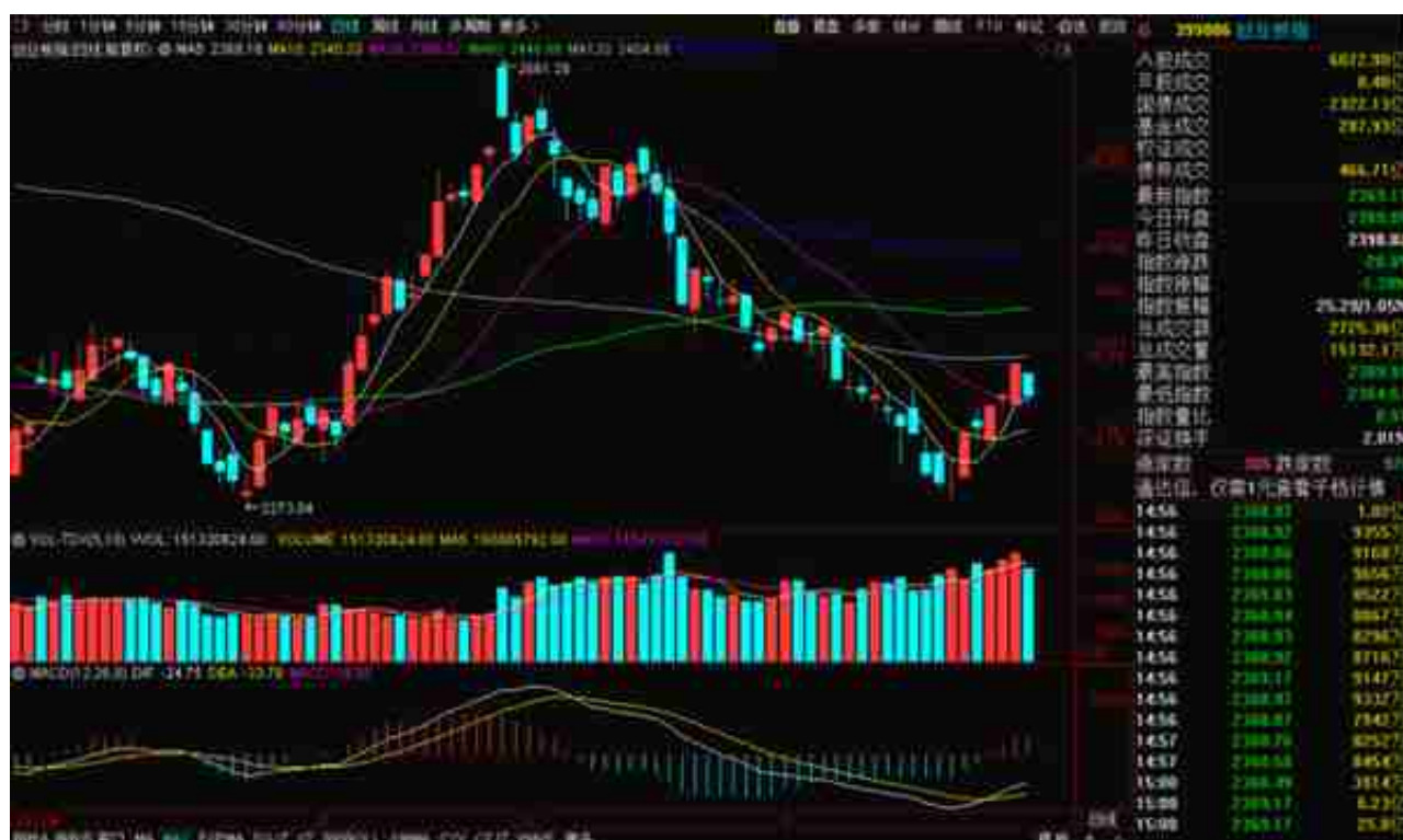
( 创业板指 )

创业板结束三天量价齐升的上涨，今天跌幅居前，沪指中午还能维持3250点小幅震荡，但是下午也出现了回落。