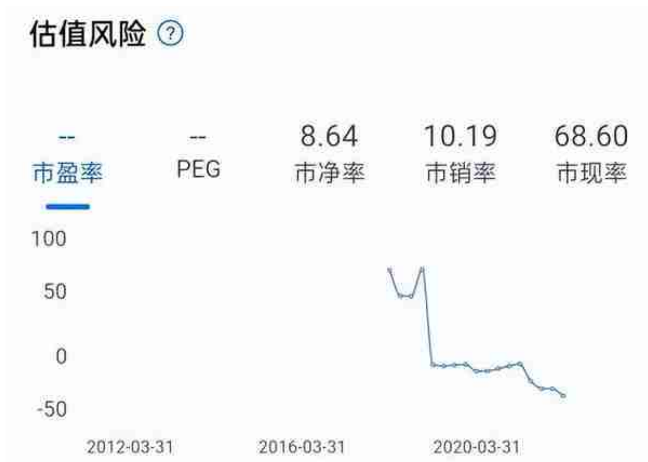
三五互联市盈率趋势图