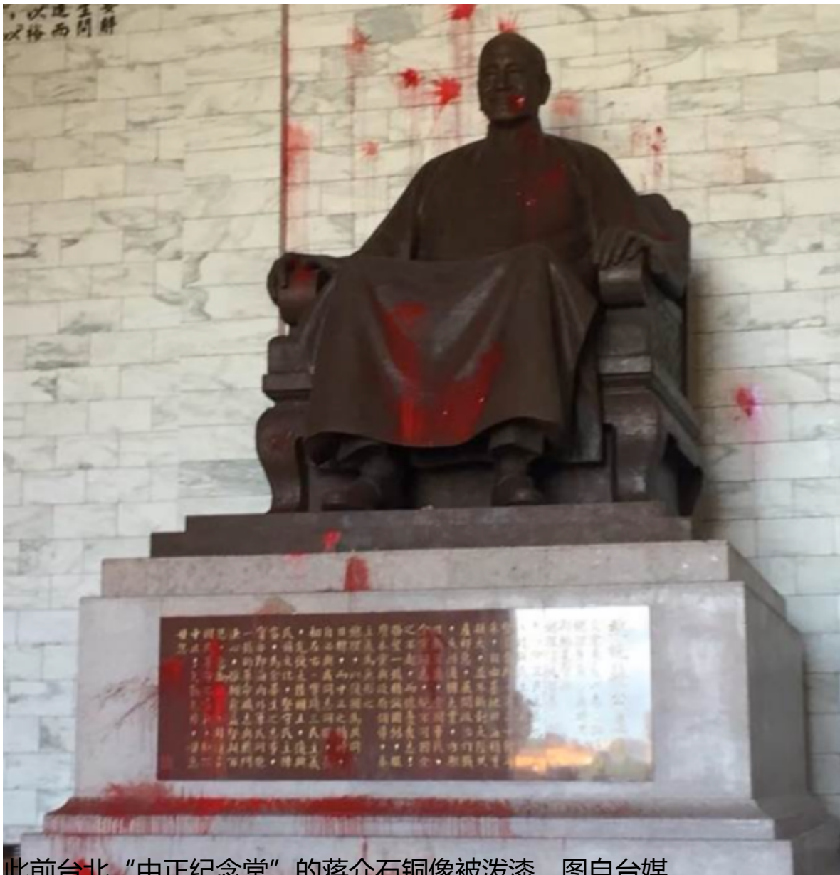
此前台北“中正纪念堂”的蒋介石铜像被泼漆。

【环球网报道】据台湾“中时新闻网”28日消息，每年花费台当局1.5亿元新台币预算的台湾“促进转型正义委员会”（简称“促转会”）在运作4年后，在被裁撤关门前提出所谓“任务总结报告”。该报告除了声称要求台当局拆除蒋介石铜像和台北“中正纪念堂”外，此次又提出要求台当局停止使用印有蒋介石头像的钞票、硬币。对此，有岛内网友吐槽，“整天搞这些意识形态”“无聊”，也有网友直斥，“真的吃饱太闲，浪费民众的纳税钱”。