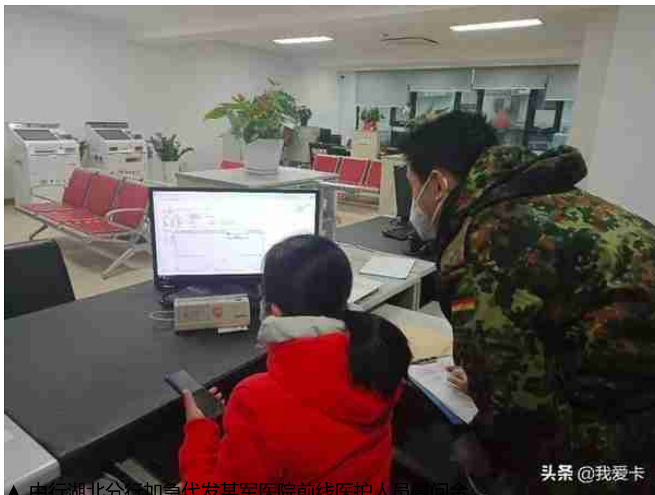
▲ 中行湖北分行加急代发某军医院前线医护人员慰问金