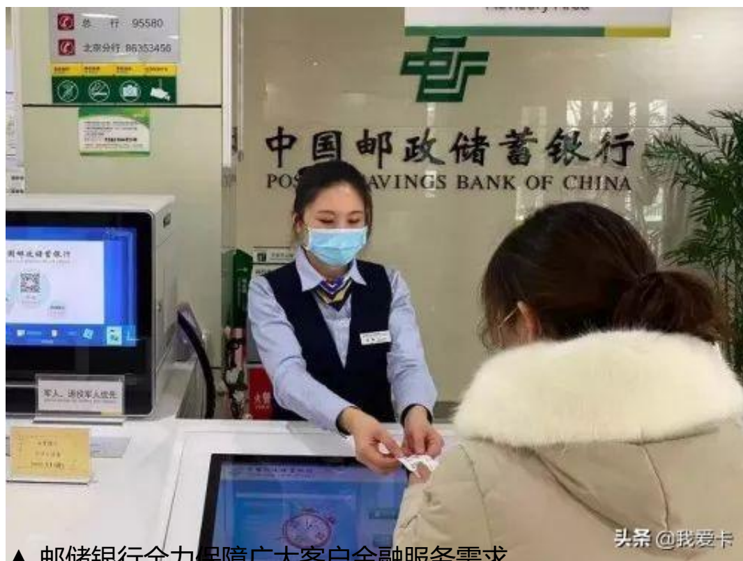
▲ 邮储银行全力保障广大客户金融服务需求