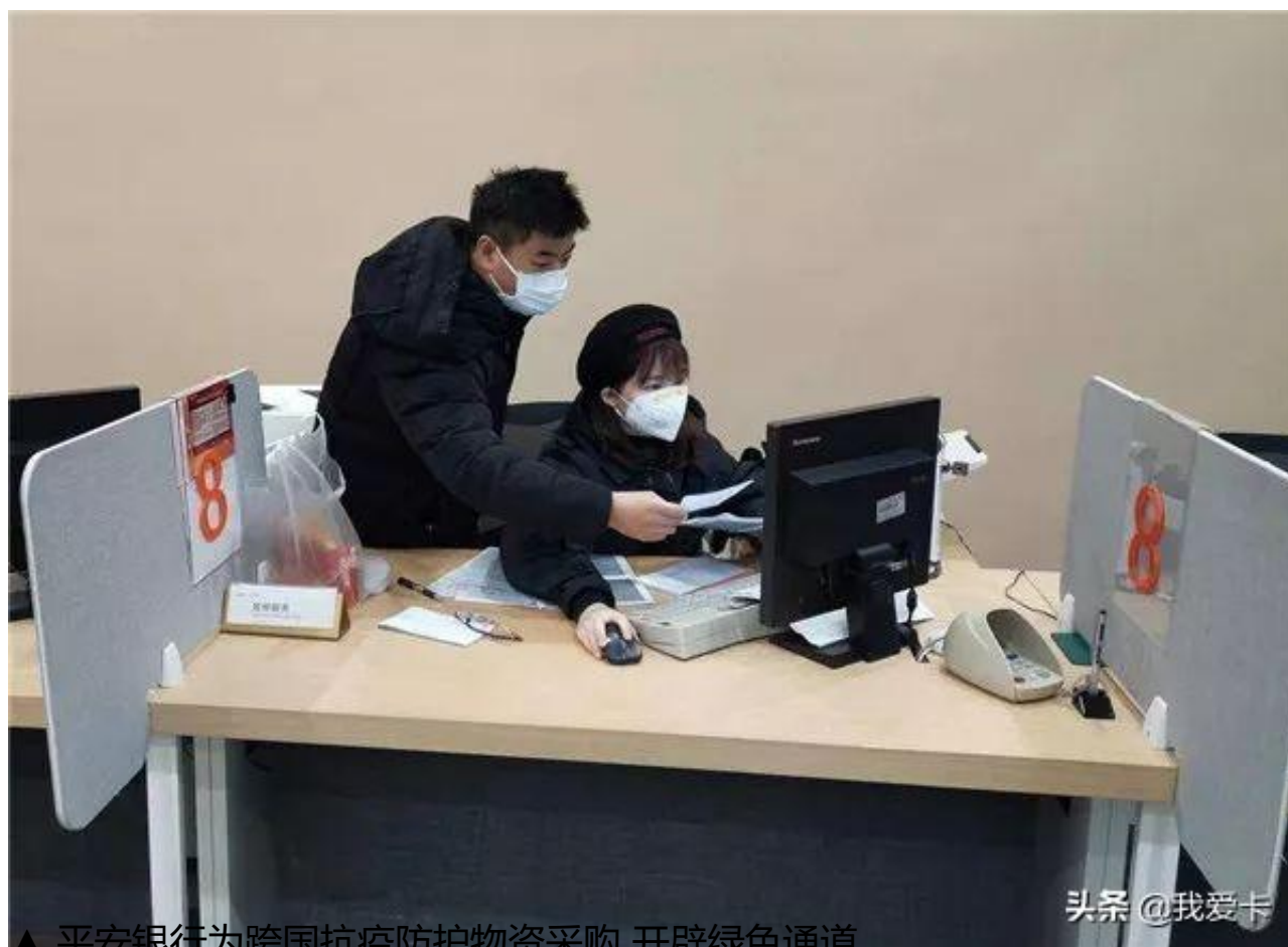
▲ 平安银行为跨国抗疫防护物资采购 开辟绿色通道