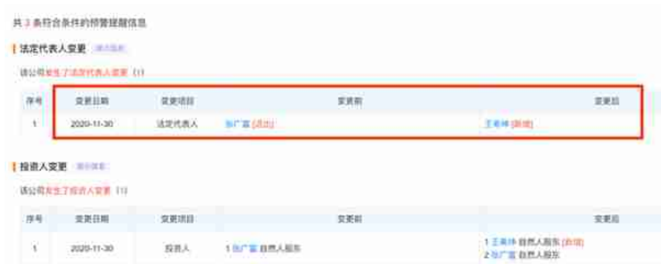
图：天眼查显示的收款方企业相关信息

何关联。如果是正规的股票交易平台，又怎么会让用户把资金转入毫不相关联的个人企业呢？