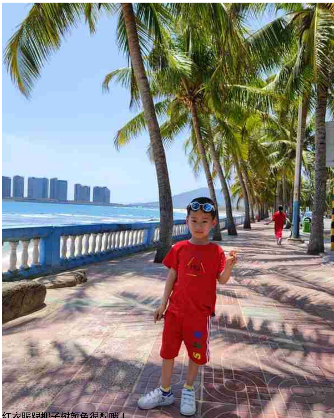
红衣服跟椰子树颜色很配哦！