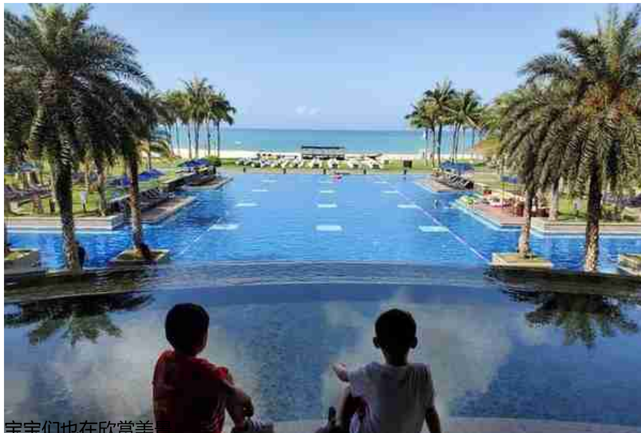
宝宝们也在欣赏美景