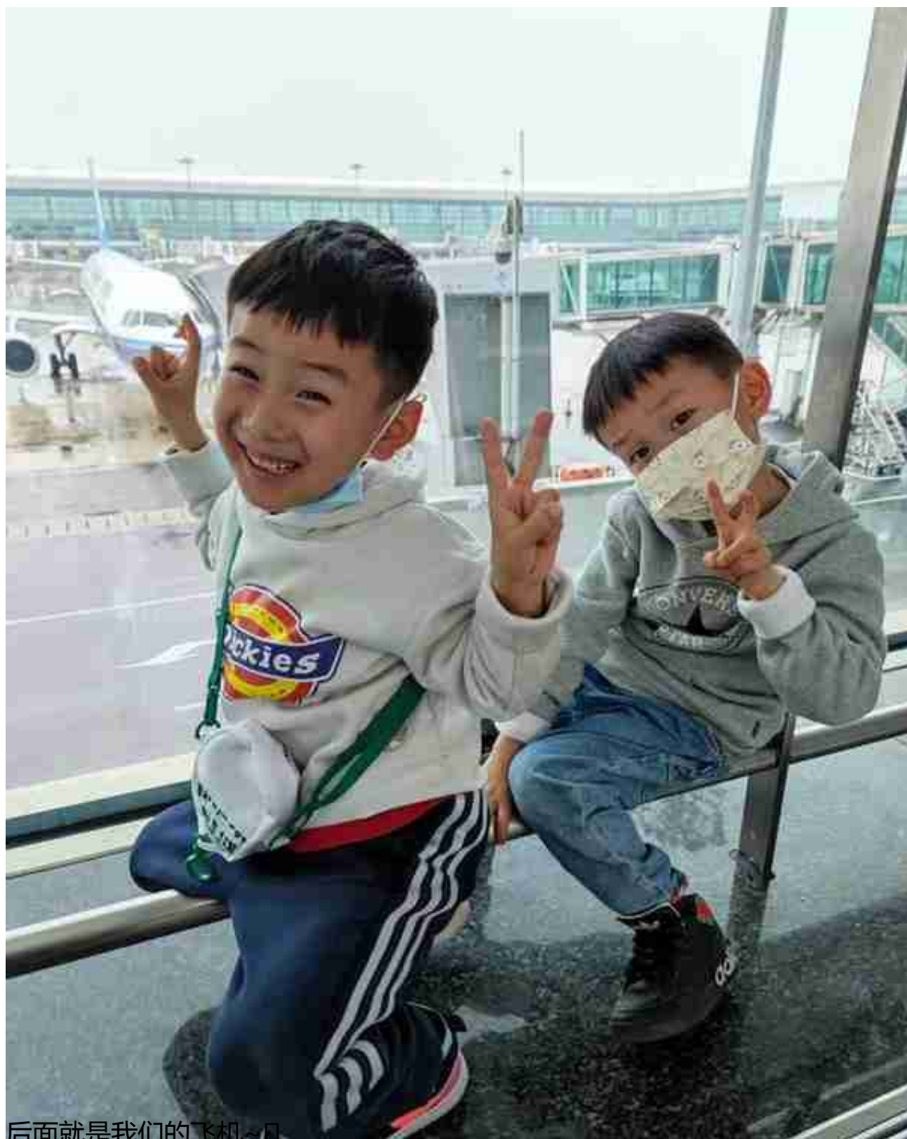
后面就是我们的飞机~☺