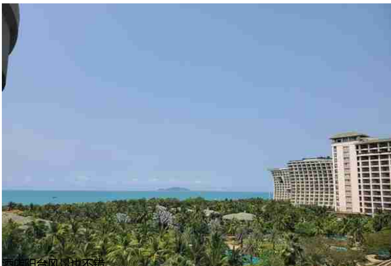
酒店阳台风景也不错