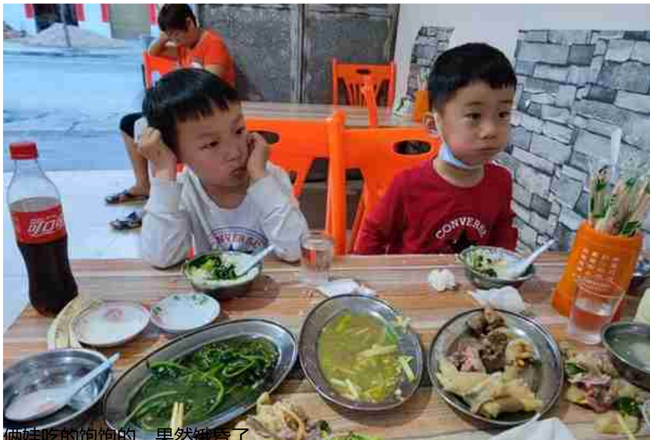
俩娃吃的饱饱的，果然饿昏了

吃饱喝足好上路了，预计车程2.5hr抵达我们要住的 万宁锦时欢聚青年旅舍，为啥选择这个便宜的青年旅社，主要我们到了的时候已经晚上21点了，所以我们舍不得住两晚喜来登，毕竟虽然是淡季可五星级的价格摆在那...咱们还是低调一点吧。