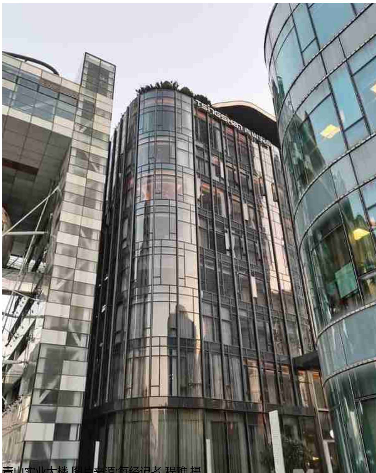
青山实业大楼

据海通证券分析，青山在国内的镍铁业务主要通过福建青拓集团布局。目前，青拓集团已形成年产180万吨镍合金的生产能力。国外业务则通过印尼青山园区（IMIP）和纬达贝工业园（IWIP）实现，总产能超过350万吨/年。