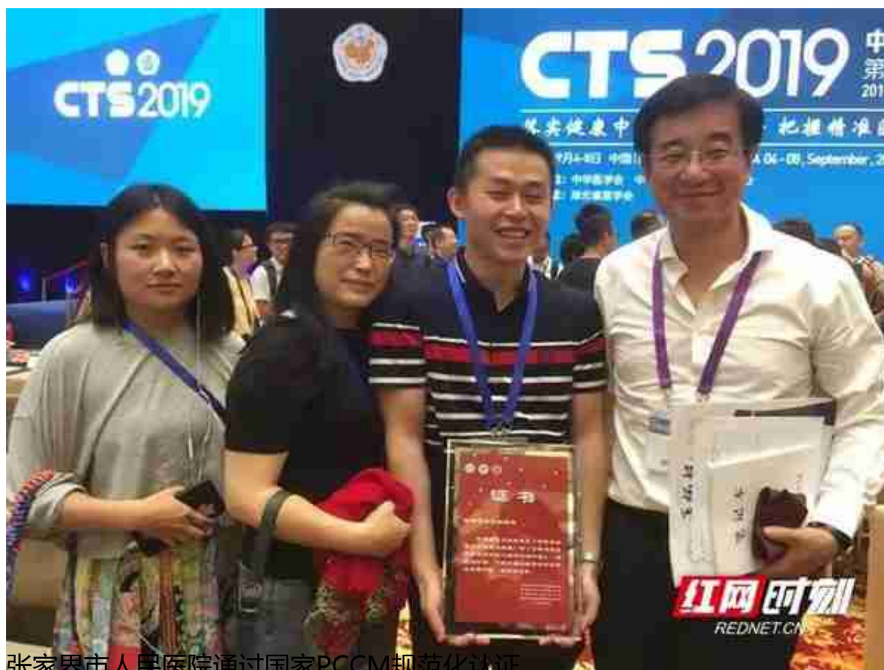
张家界市人民医院通过国家PCCM规范化认证

9月5日，在湖北武汉召开的中华医学会呼吸病学年会开幕式上，张家界市人民医院获颁国家PCCM科规范化建设项目三级医院达标证书，标志着该院呼吸与危重症学