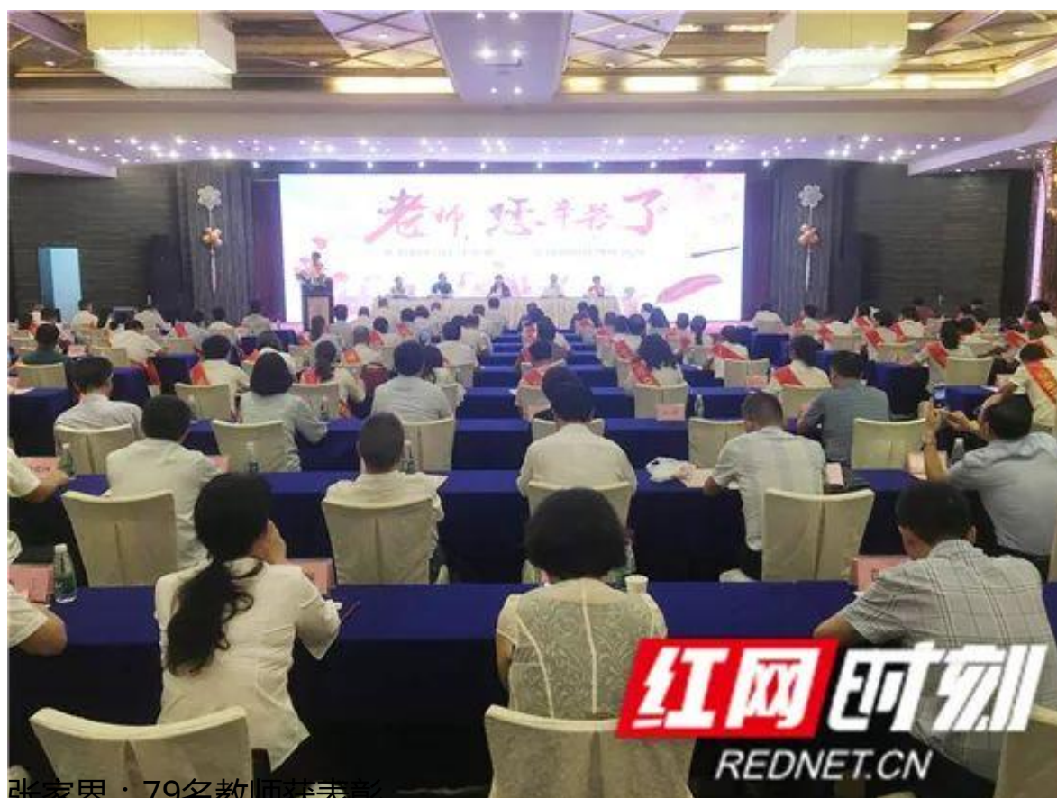
张家界：79名教师获表彰