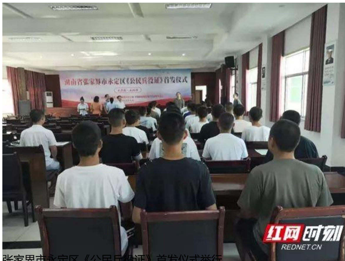
张家界市永定区《公民兵役证》首发仪式举行

9月6日上午，张家界市永定区征兵办联合邮政储蓄银行张家界市分行在永定区武装部举行“湖南省公民兵役证”首发仪式，近百名青年领取了公民兵役证。