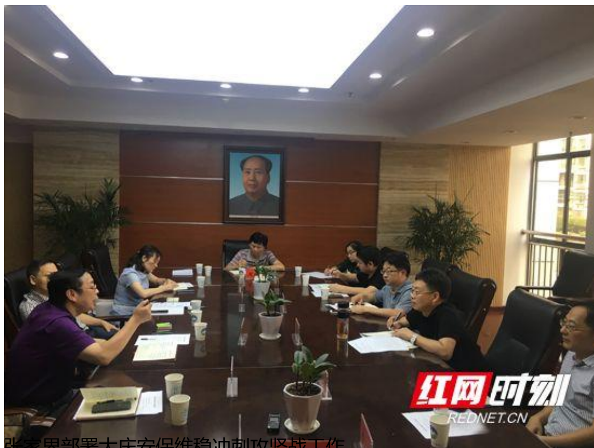
张家界部署大庆安保维稳冲刺攻坚战工作