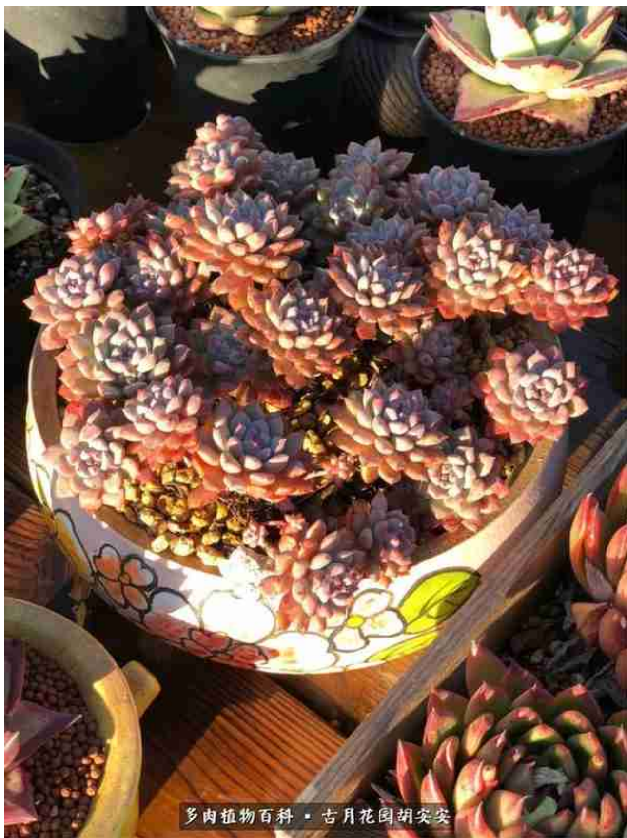
多肉植物百科 · 古月花园胡安安