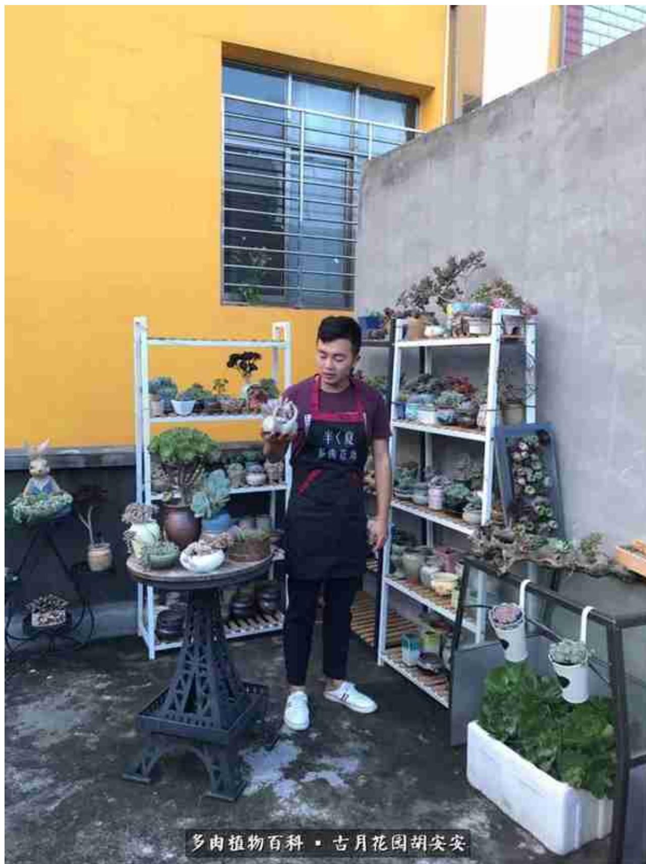
多肉植物百科 · 古月花园胡安安