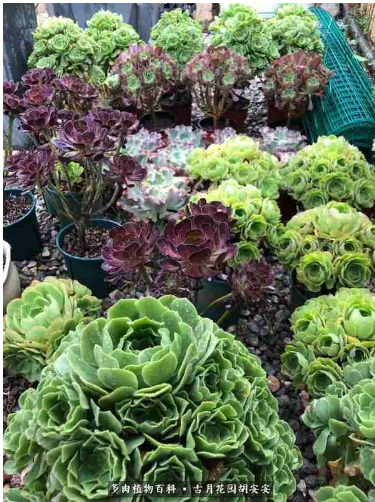
多肉植物百科 · 古月花园胡安安