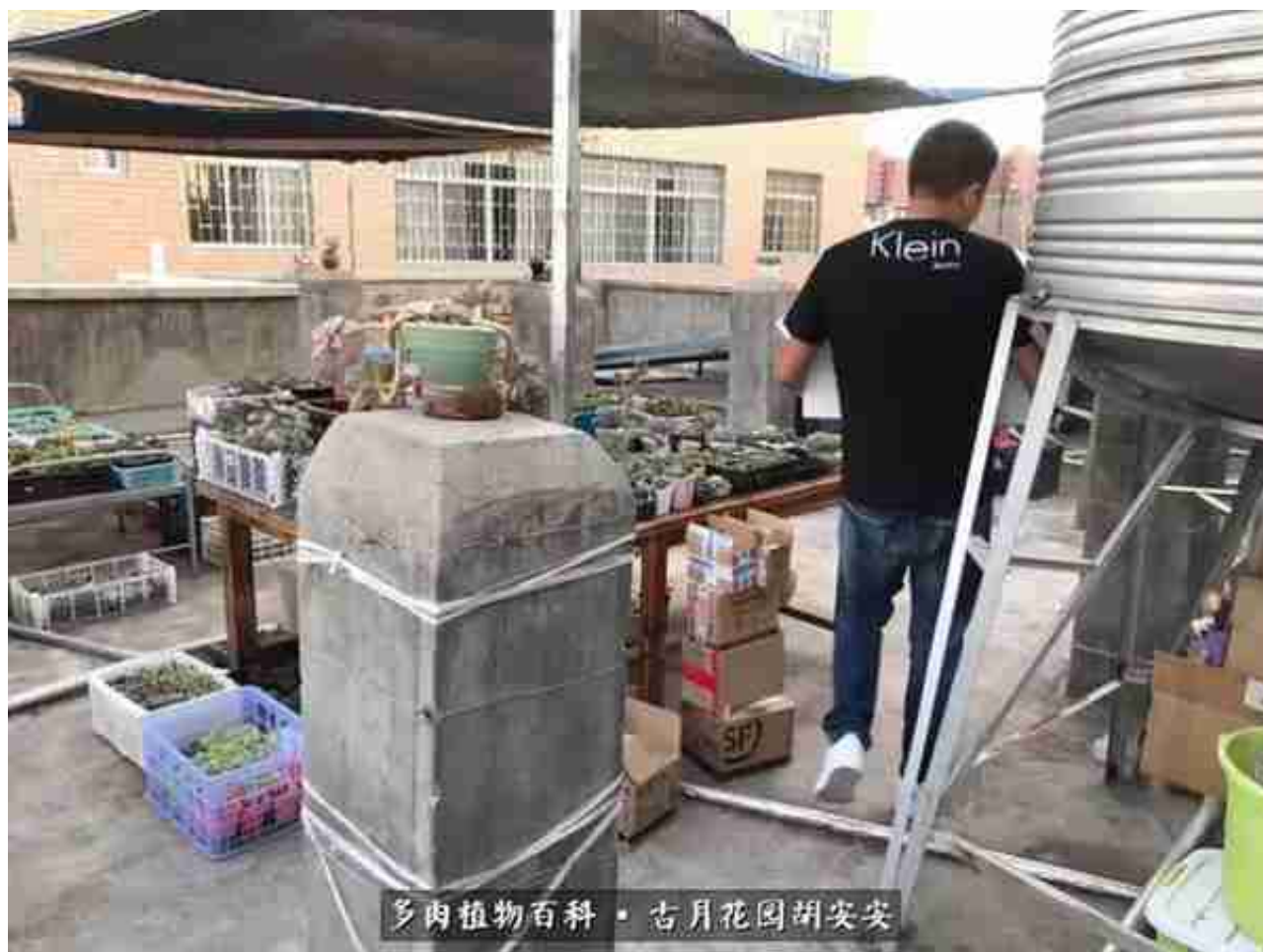
多肉植物百科 · 古月花园胡安安

那天夏天，从苏君的图片里掉入了法师坑：黑法师，绿法师，墨法师，拉丝锦，紫羊绒，绿羊绒，韶秀……太多太多，特别是夏季休眠期会令法师们颜色状态各异，让我加速了想拥有一个花园的想法。