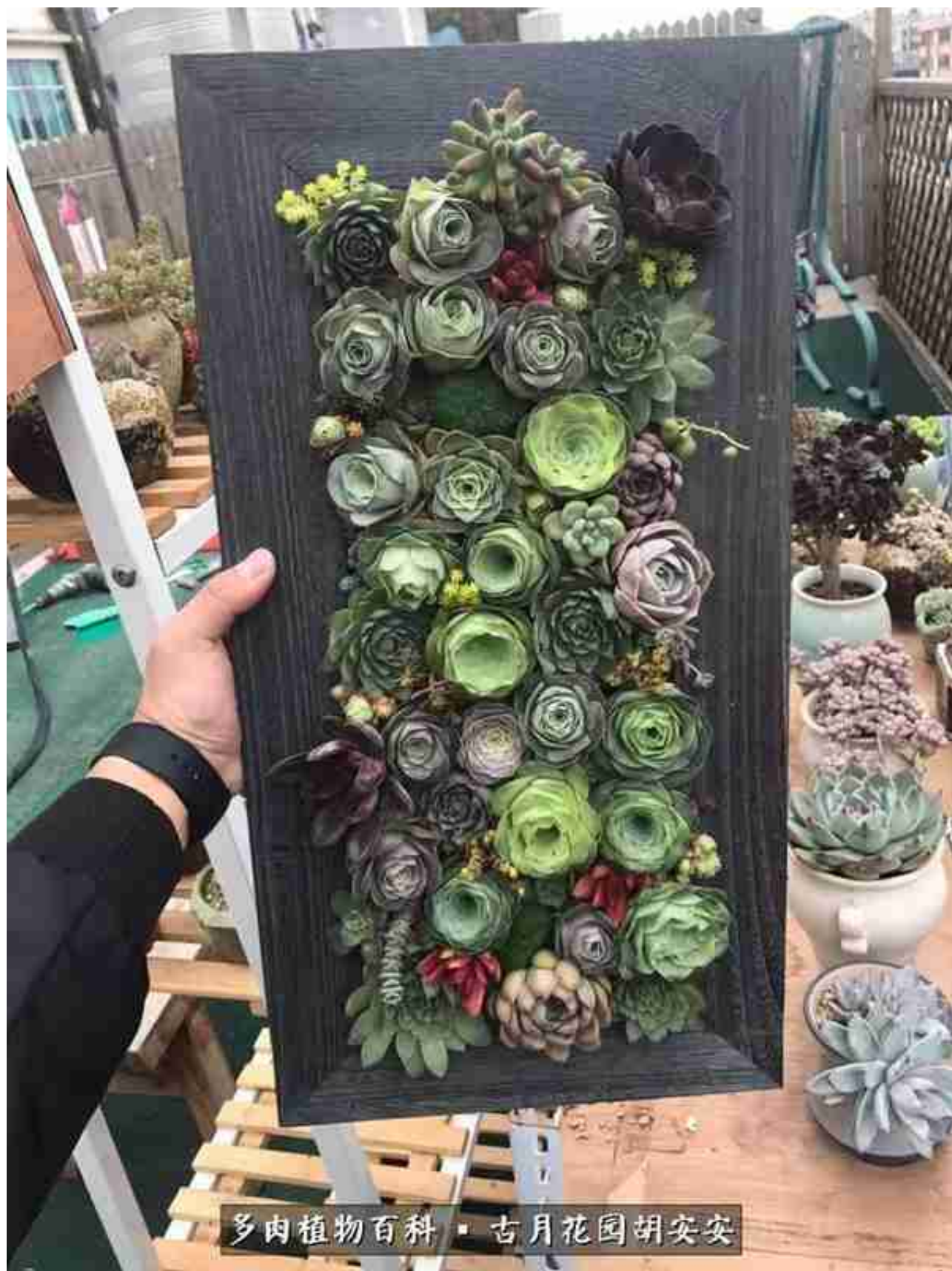
多肉植物百科 · 古月花园胡安安