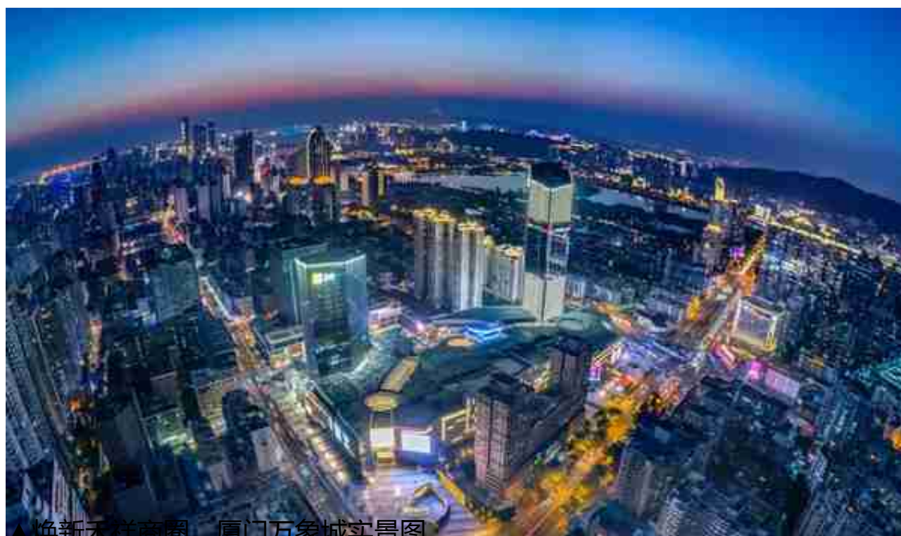
▲焕新禾祥商圈，厦门万象城实景图

在福州，能谓之大魄力开启新时代的，一定得是“大家”，骨子里即写满优质商业文化基因。