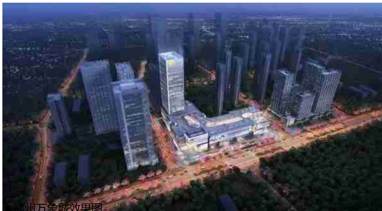
福州万象城效果图

持续锻造“中国商业运营管理第一品牌”的华润万象生活的做法是，缺啥补啥，用万象城给福州的高端商业补位填坑。