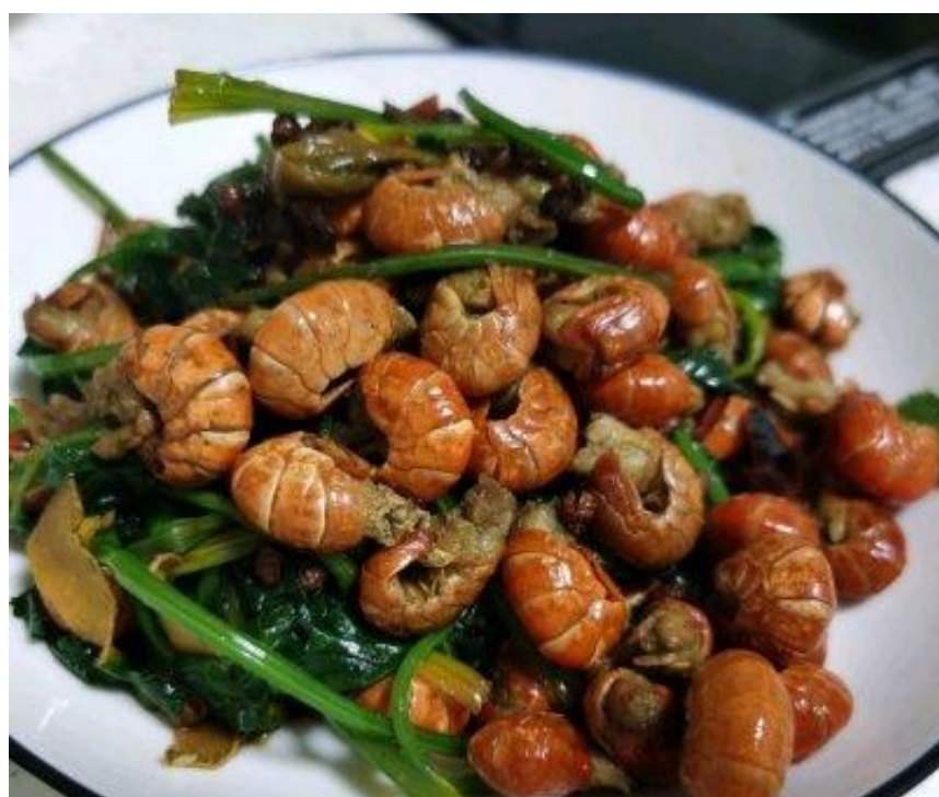
7、汤下去之后放一丢丢鸡精，出锅！香菜也非常好吃