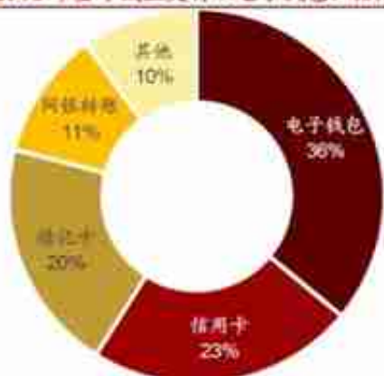
图 24: 2018 年全球线上支付以电子钱包、信用卡为主 图 25: 2018 年全球线下支付以现金、电子钱包为主

关注“财资一家”微信公众号（微信ID：TreasuryChina），获取更多财资知识。