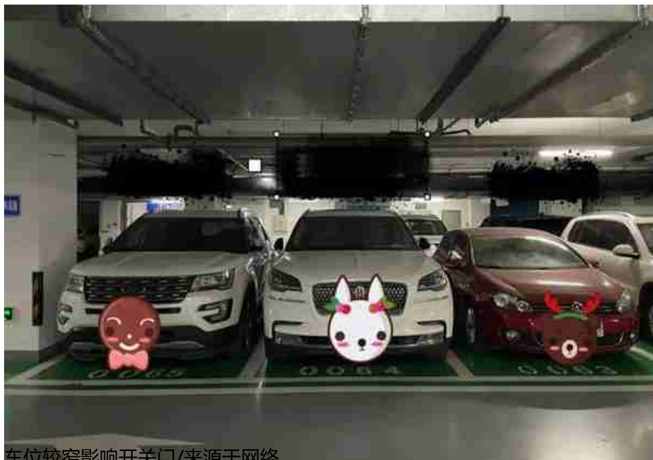
车位较窄影响开关门

近年来，中大车型尤其是SUV车型越来越受消费者的青睐。但在一些公共场所和小区停车场，车位空间比较局促，不但上下车不方便，也很容易剐蹭到邻车。是车买大了，还是车位该“加码”了？一起来听北京交通广播记者陈常松的报道：