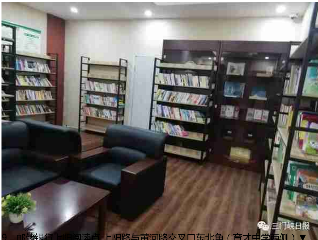
9、邮储银行上阳阅读点 上阳路与黄河路交叉口东北角（育才中学西侧）▼