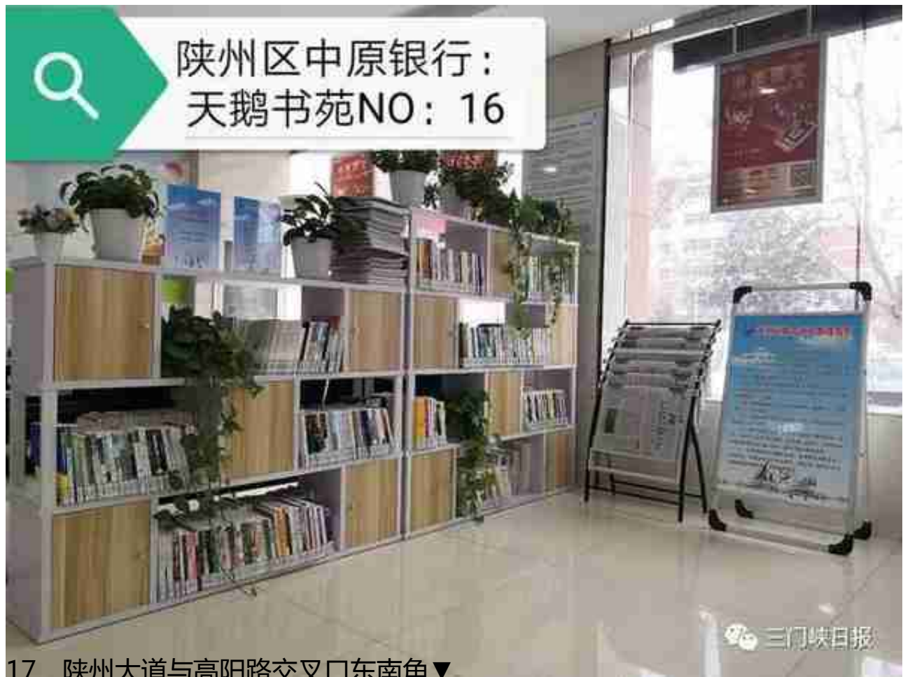
17、陕州大道与高阳路交叉口东南角▼