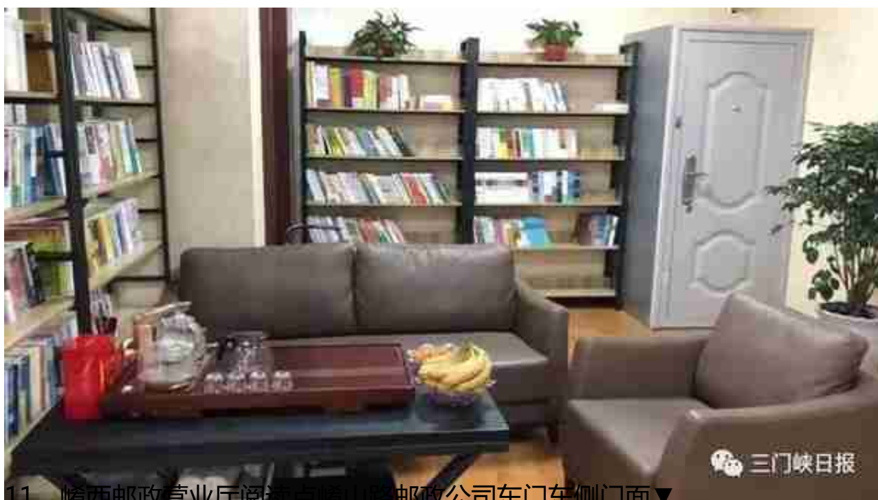
11、崱西邮政营业厅阅读点崱山路邮政公司东门东侧门面▼