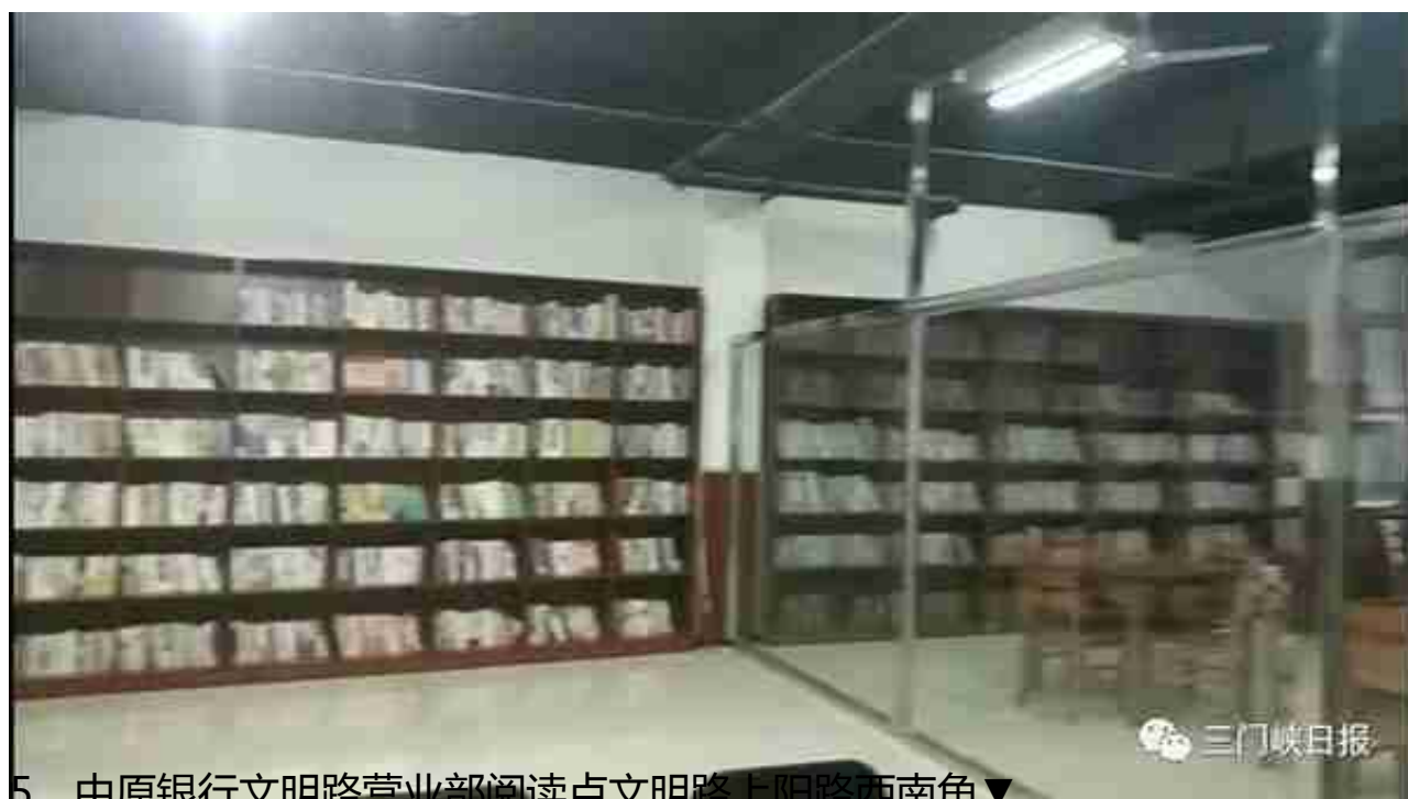
5、中原银行文明路营业部阅读点文明路上阳路西南角▼