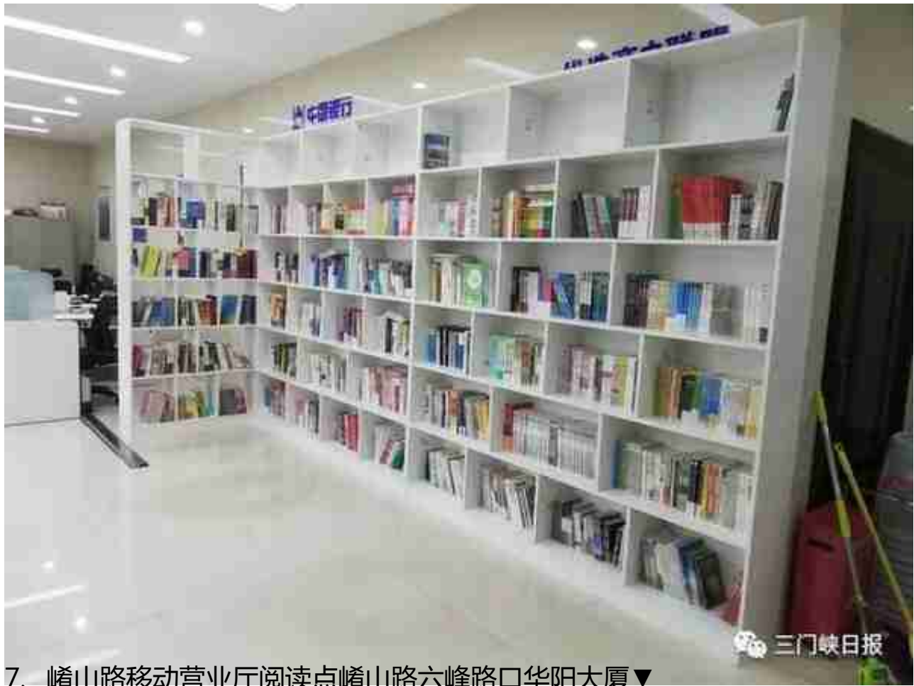
7、崱山路移动营业厅阅读点崱山路六峰路口华阳大厦▼