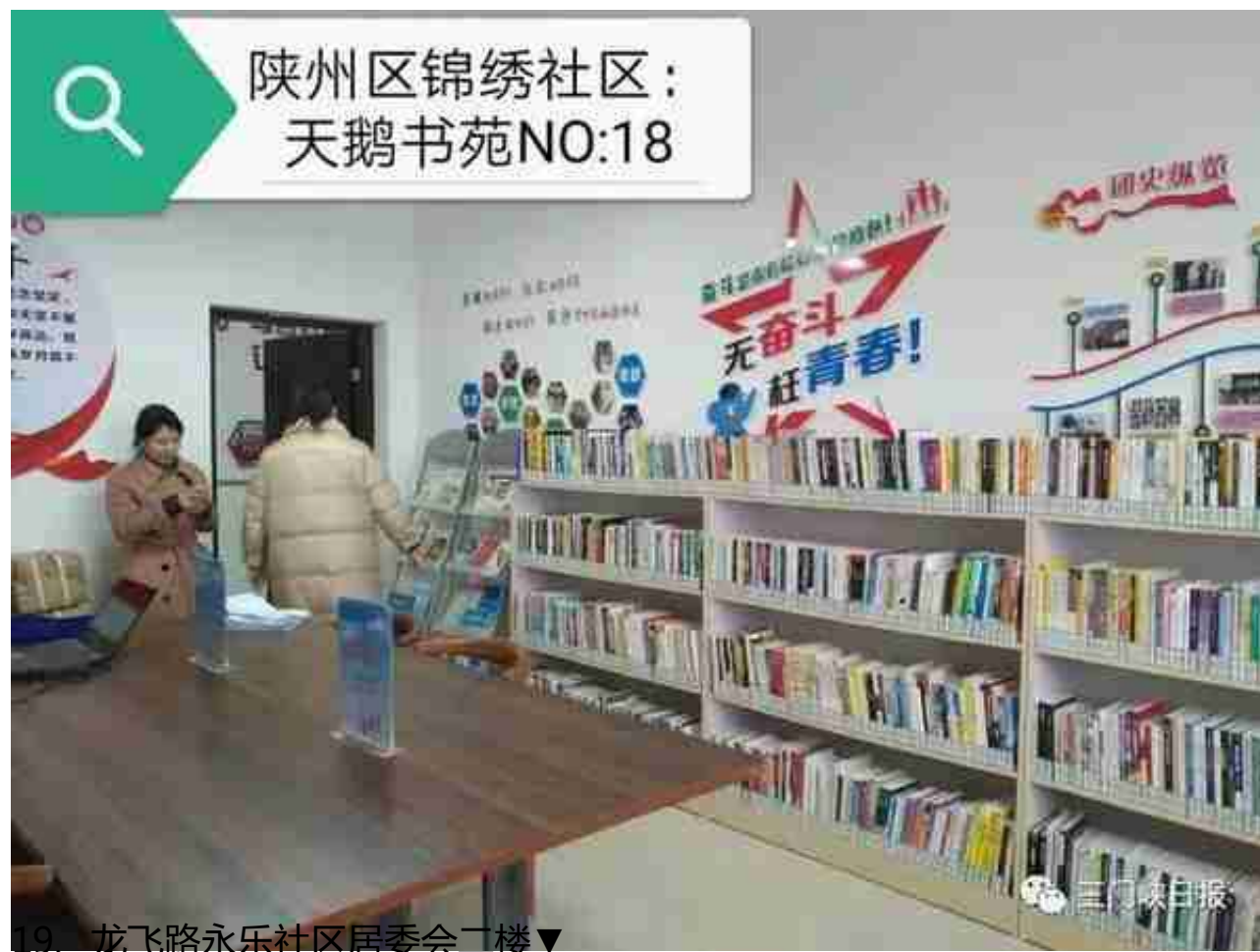
19、龙飞路永乐社区居委会二楼▼