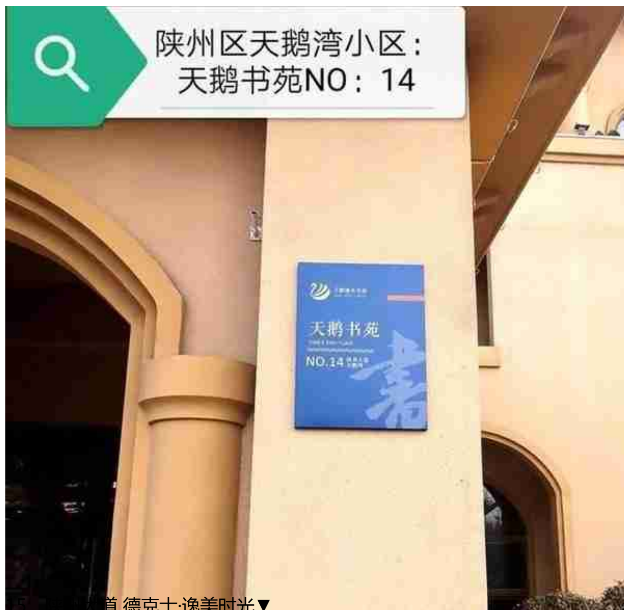
15、陕州大道 德克士·逸美时光 ▼