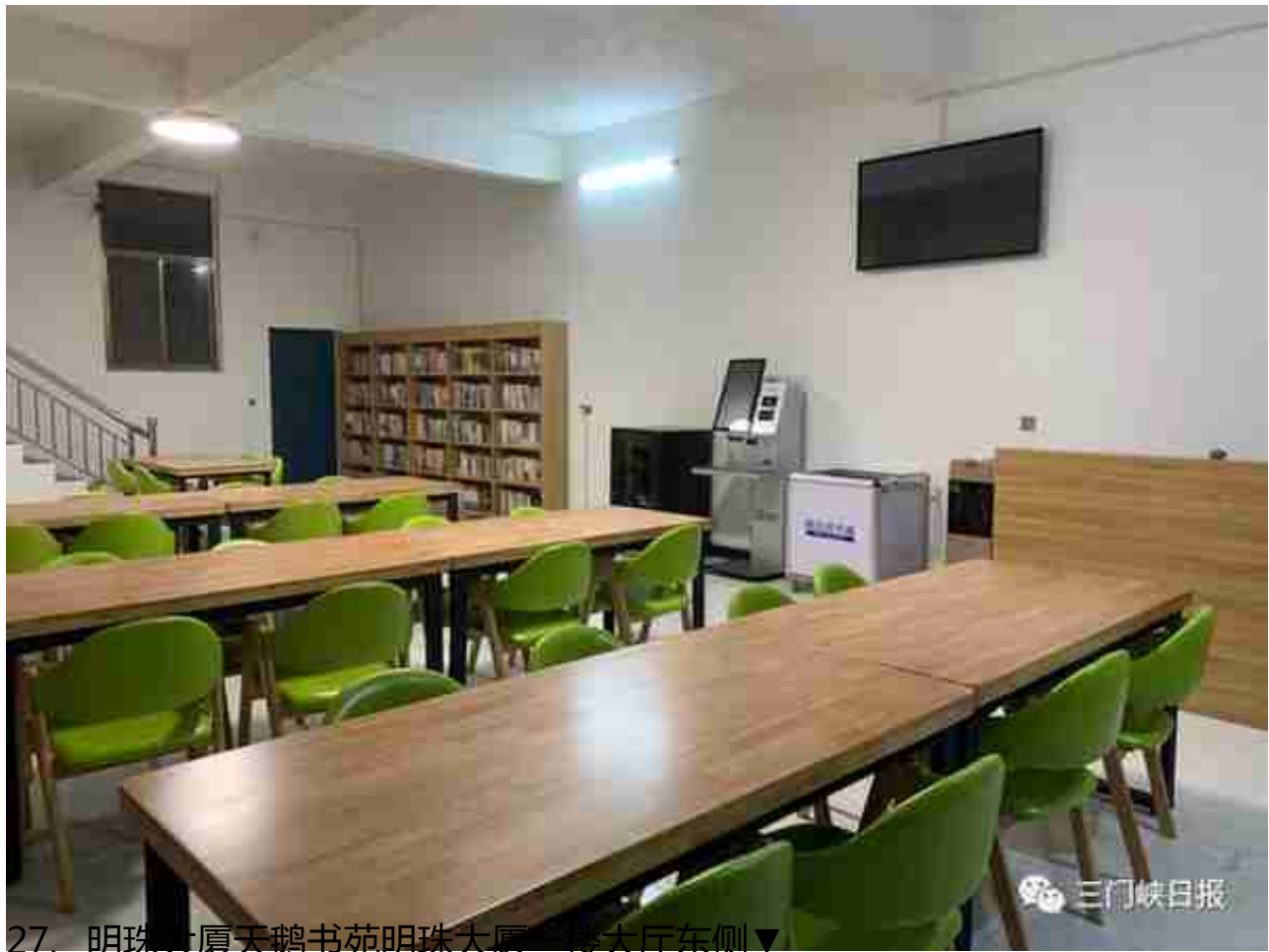
27、明珠大厦天鹅书苑明珠大厦二楼大厅东侧▼