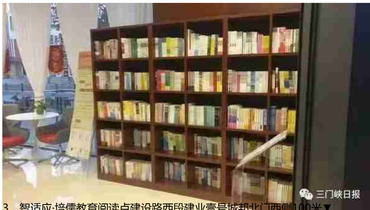
3、智适应·培儒教育阅读点建设路西段建业壹号城邦北门西侧100米▼