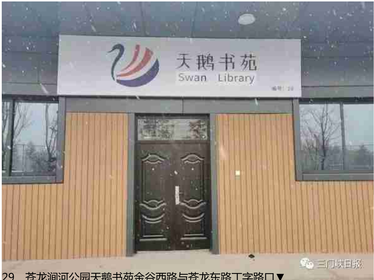
29、苍龙涧河公园天鹅书苑金谷西路与苍龙东路丁字路口▼