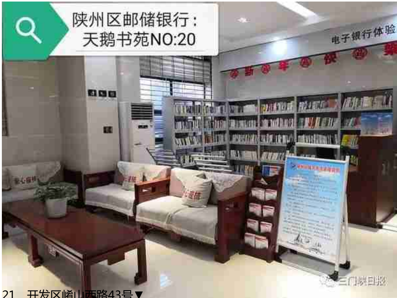
21、开发区崱山西路43号▼