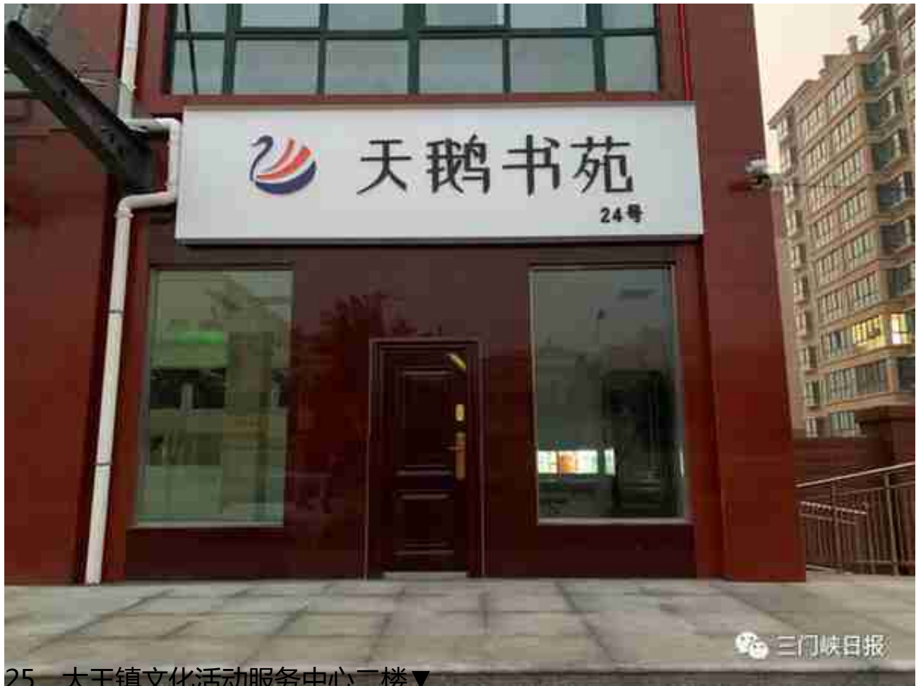
25、大王镇文化活动服务中心二楼▼