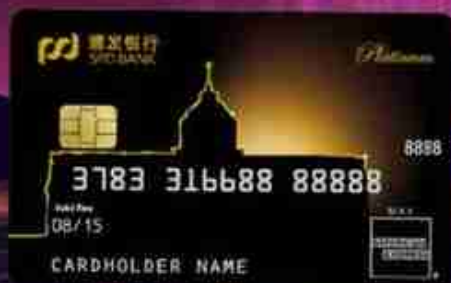
浦发美国运通®白金信用卡 (人民币卡)