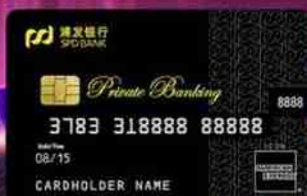
浦发美国运通®超白金信用卡 (人民币卡)

美国运通®是美国运通公司注册商标。 此卡为由浦发银行发行的美国运通品牌人民币结算信用卡。