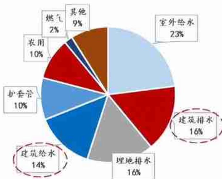
图 19：国内塑料管道下游消费占比

近日网上发布了一条视频，画面中为新疆一条沙漠公路的施工现场，30余台推土机把在高耸的沙丘间纵横往返，推出路基，机器轰鸣，场景震撼！引爆了“基建狂魔又对新疆的沙漠动手了”的话题。