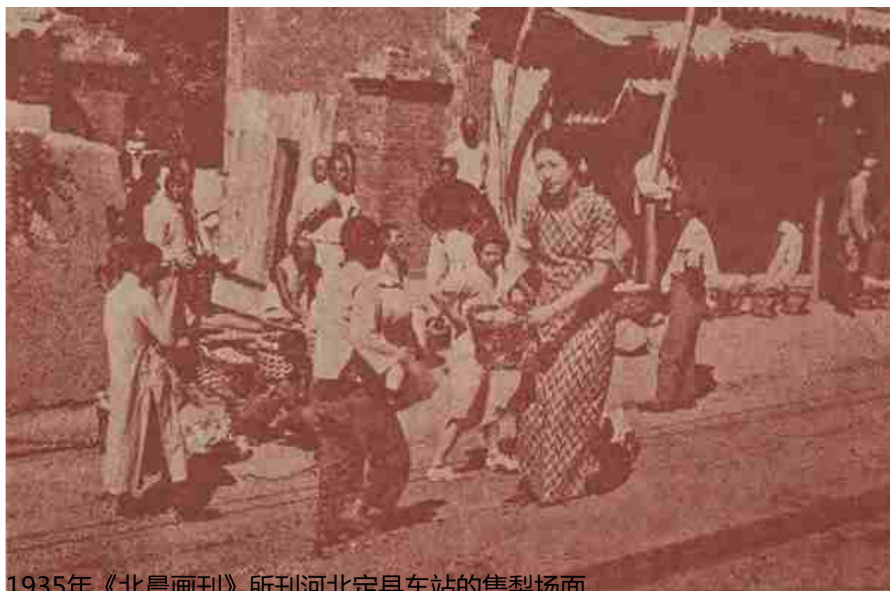
1935年《北晨画刊》所刊河北定县车站的售梨场面

由齐鲁大地北上，华北的京津地区亦有诸多名品甜梨。且以京城附近的梨产为例，略现其精彩。1937年，《现象》月刊介绍了北平的几种土产梨子。