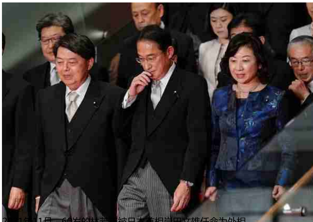
2021年11月，60岁的林芳正被日本首相岸田文雄任命为外相。

林芳正去年4月在布鲁塞尔参加北约外长会时，曾就乌克兰局势公开批评中国。今年3月7日，他在国会上表达了对中国军力不断增强的担忧，称其为“日本前所未有的最大战略挑战”。