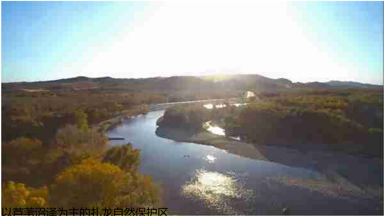
以芦苇沼泽为主的扎龙自然保护区