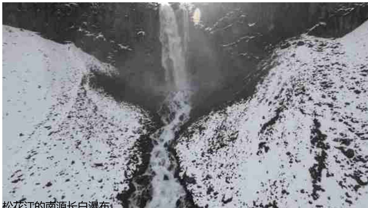
松花江的南源长白瀑布