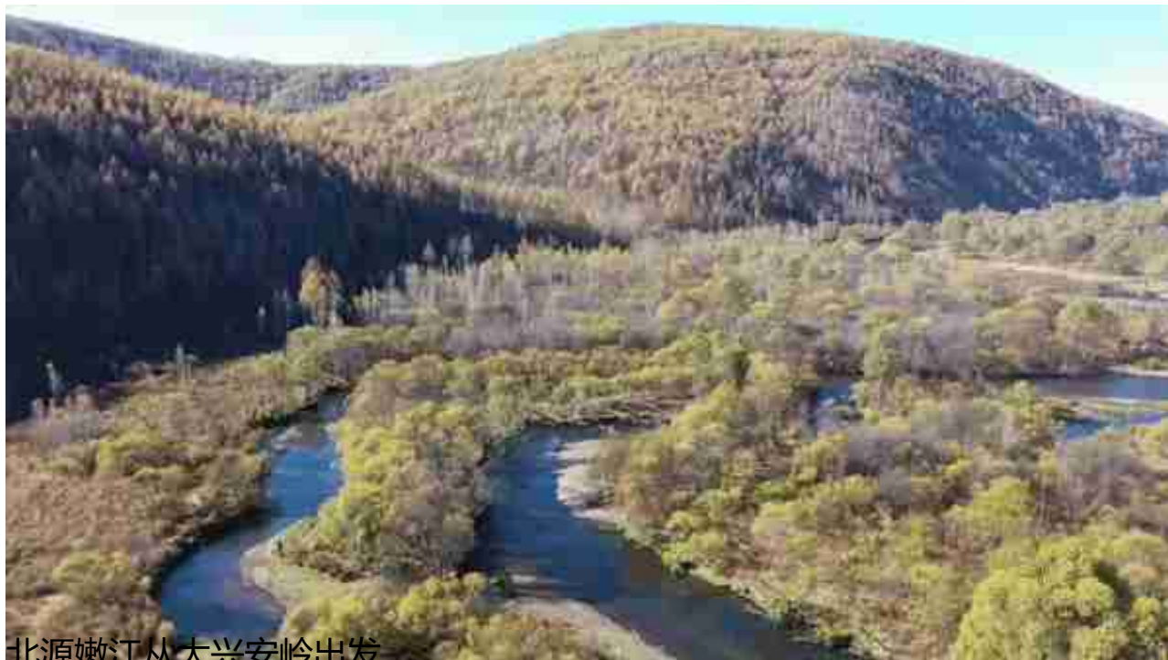
北源嫩江从大兴安岭出发