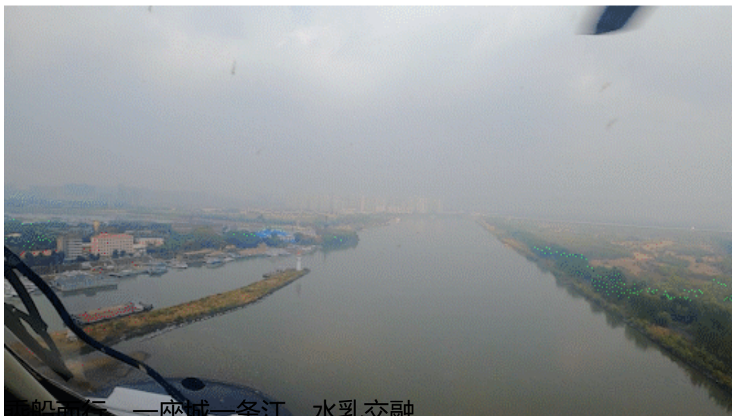
乘船而行，一座城一条江，水乳交融