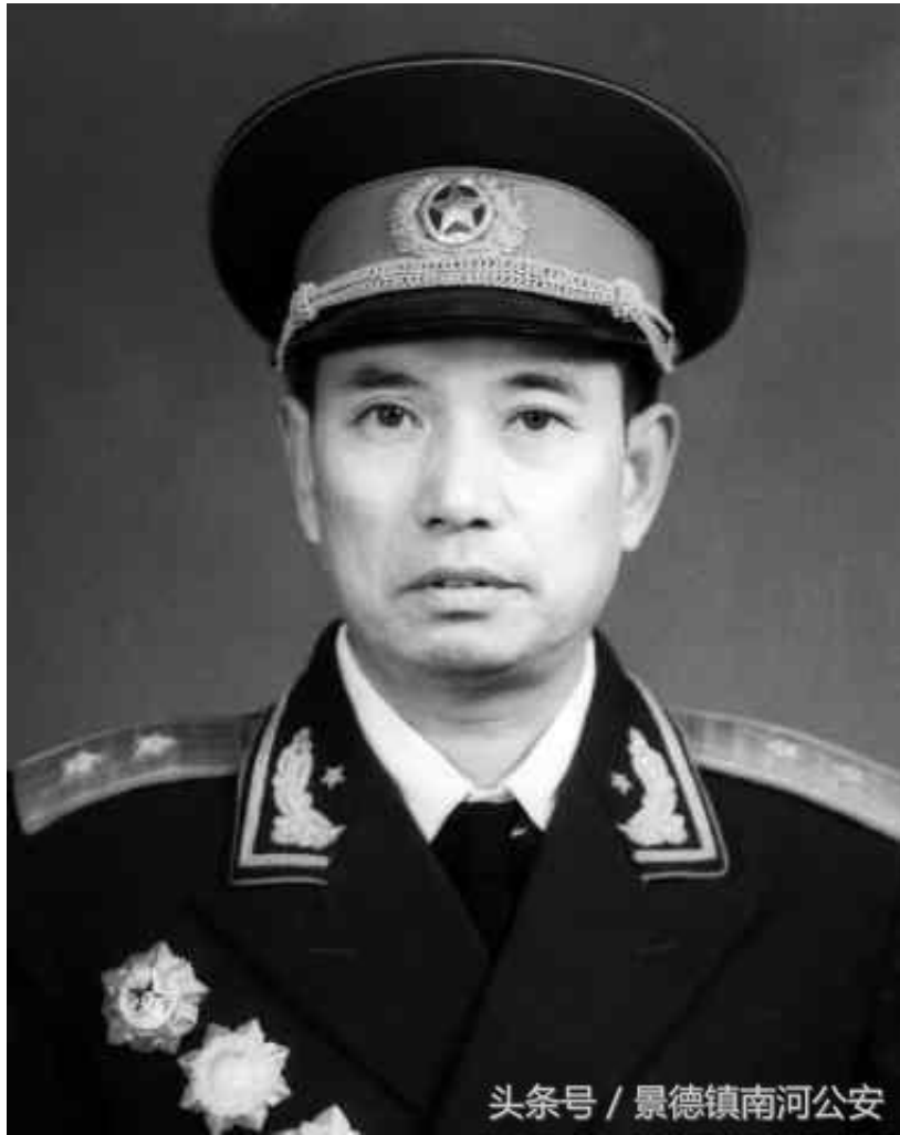
头条号 / 景德镇南河公安