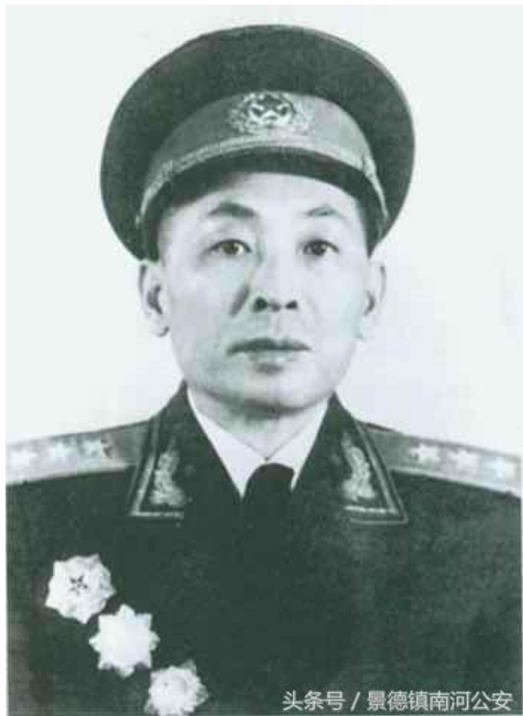
头条号 / 景德镇南河公安

在解放战争中，华野1纵(军)以跑得、饿得、打得著称，在华东战场，驰骋豫皖，纵横苏鲁，战皆硬仗，屡建奇功，最辉煌莫过于莱芜战役，此役一纵(军)在友邻部队没赶到情况下，紧钳5万多国军，临危不惧，让李仙洲无路可逃，为歼李仙洲集团