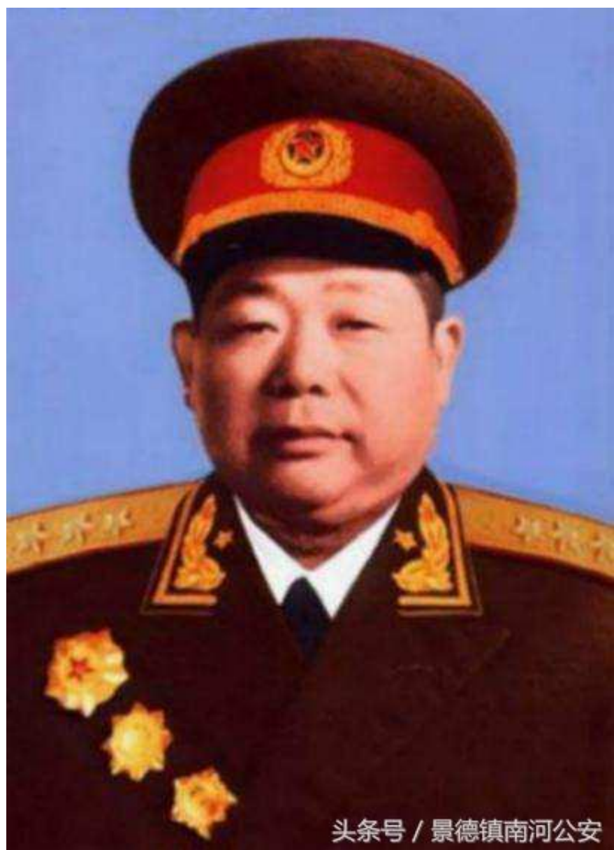
头条号 / 景德镇南河公安