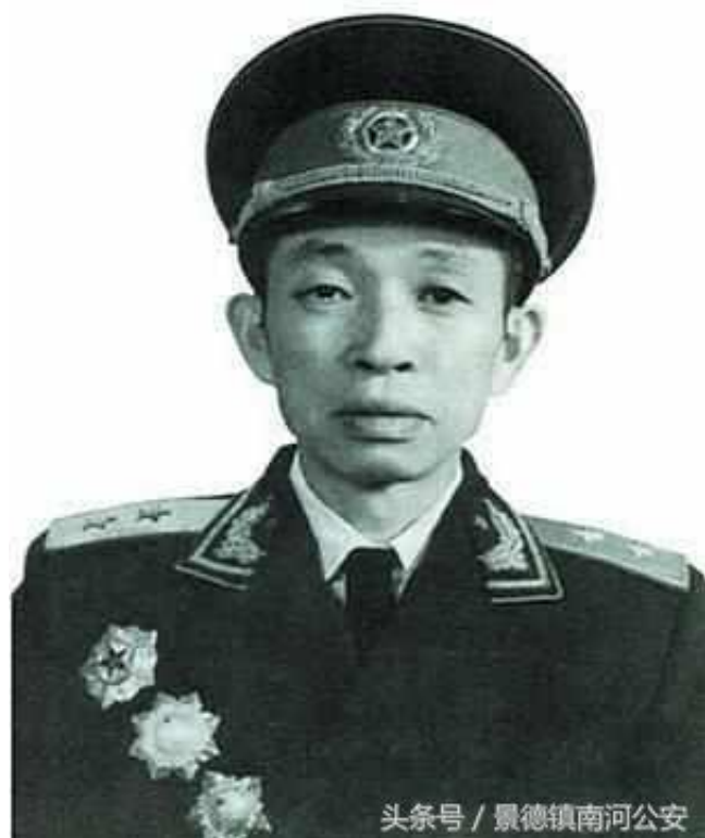
头条号 / 景德镇南河公安

在解放战争中，华野6纵(军)一直是华野主力纵队(军)之一，司令员王必成被敌我双方共称为王老虎，他所率六纵(军)是一支能打、会打、敢打的虎军，经历华东数次大战，战史亮点：首先苏中战役中除害，歼灭李默庵的王牌部队，从此打消了我军对国军美械装备部队的顾虑，在莱芜战役的吐丝口战斗中，斩获敌军2万多，此役中歼敌数我军参战部队中第一，另外六纵(军)与蒋介石嫡系、精锐、五大主力之首、全美械装备七十四师，一直很有缘，一战涟水，硬是把风头正劲的74师压了下去，这好比是迎头浇了正火热的74师一盆冷水，此后两军再战，74师依靠数量和装备的优势，使六纵(军)不得不撤出涟水，但74师也付出惨重的代价，以至后来在孟良固被俘的74师军官说到：其实74师在在涟水之战中已被重创了元气。在孟良固战役