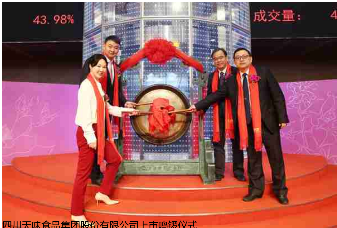
四川天味食品集团股份有限公司上市鸣锣仪式