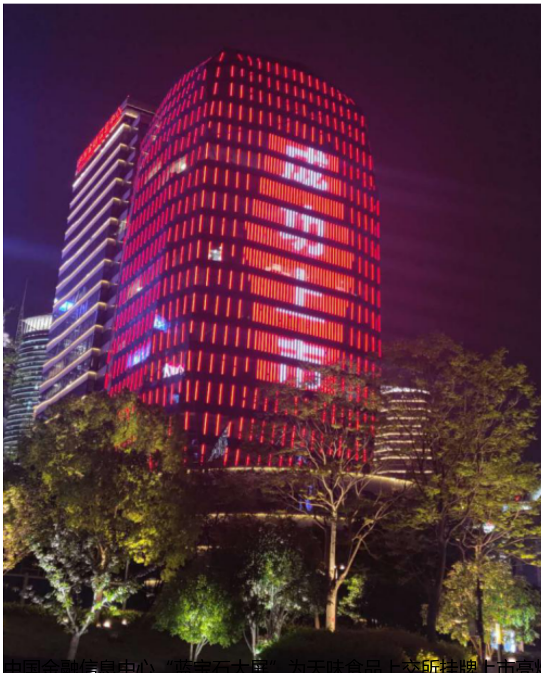
中国金融信息中心“蓝宝石大屏”为天味食品上交所挂牌上市亮灯（3）