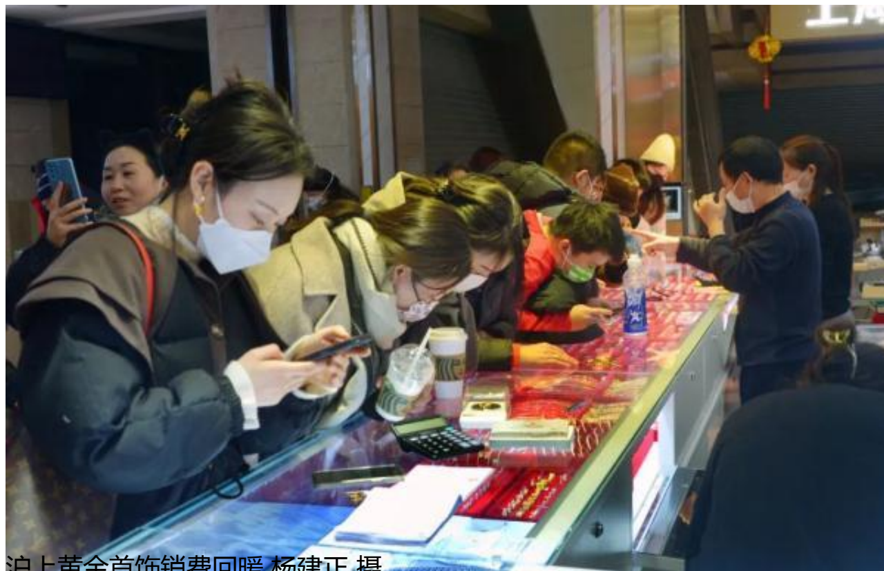
沪上黄金首饰消费回暖