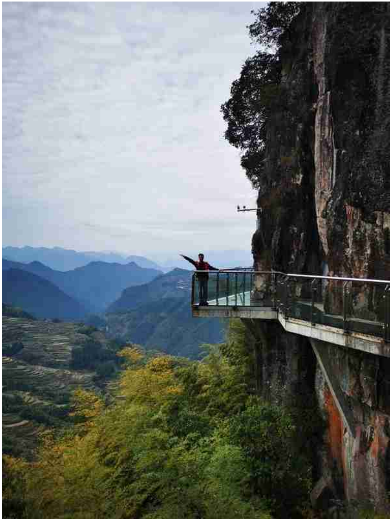
玻璃栈道与玻璃桥遥相呼应。