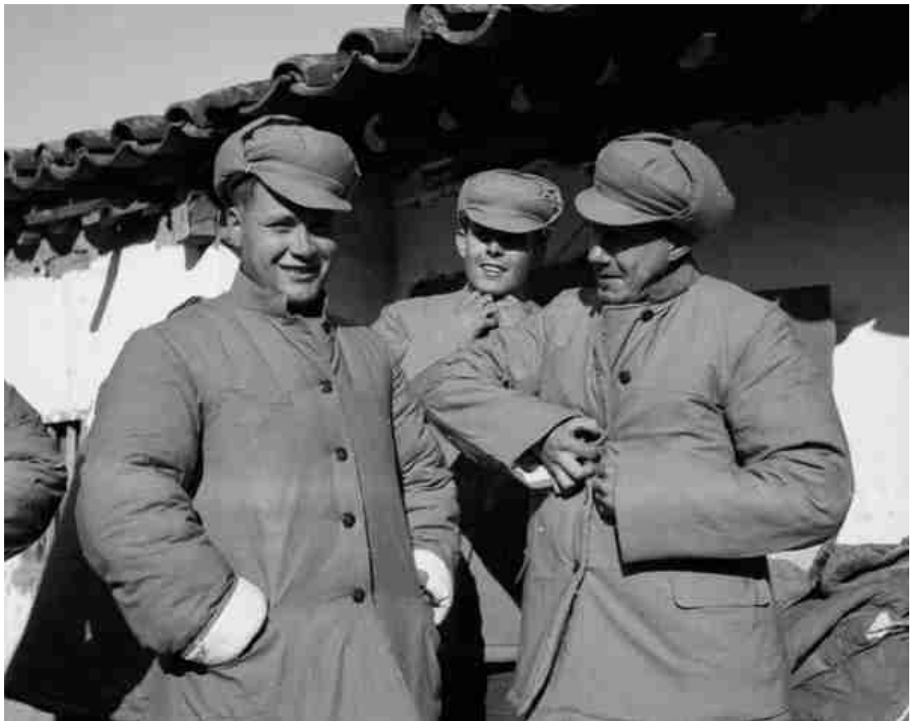
朝鲜战争。碧潼战俘营。美国战俘都穿上了志愿军的制服。