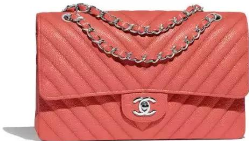
CLASSIC HANDBAG SGD 7,990*