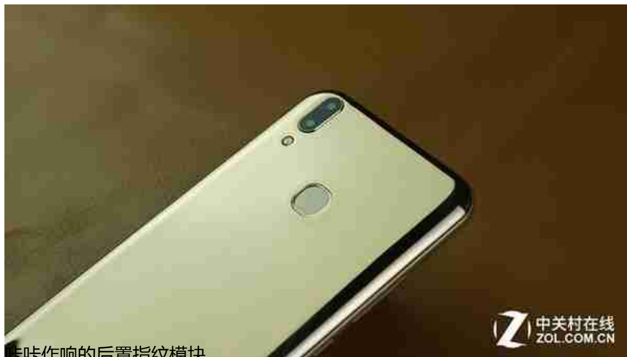
咔咔作响的后置指纹模块

说实话，第一眼看到M20的时候，其实我的第一观感其实不错——当然这样不排除是因为我提前把心里预设定的足够低的缘故。正面是无按键的刘海屏设计，只不过就是边框稍微宽了些嘛；背面的布局也非常熟悉，左上方的竖直双摄和居中的后置指纹设计。这一切看上去都是如此熟悉，但现在手机同质化现象本就严重，更不要说它还贴心的带了手机壳跟贴膜。